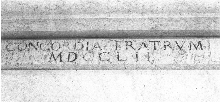
Natpis na nekadašnjoj kući Sasso, danas Hotel Concordia u Trogiru

hotel koji je prema natpisu što se nalazi na nadvratniku na južnom pročelju CONCORDIA FRATRUM MDCCLII nazvan Concordia. 62 Sjeverni dio kuće još uvijek je stambeni prostor. 63 Sačuvan je i sjeverozapadni ugao kuće koji je nekoć gledao prema samostanu.