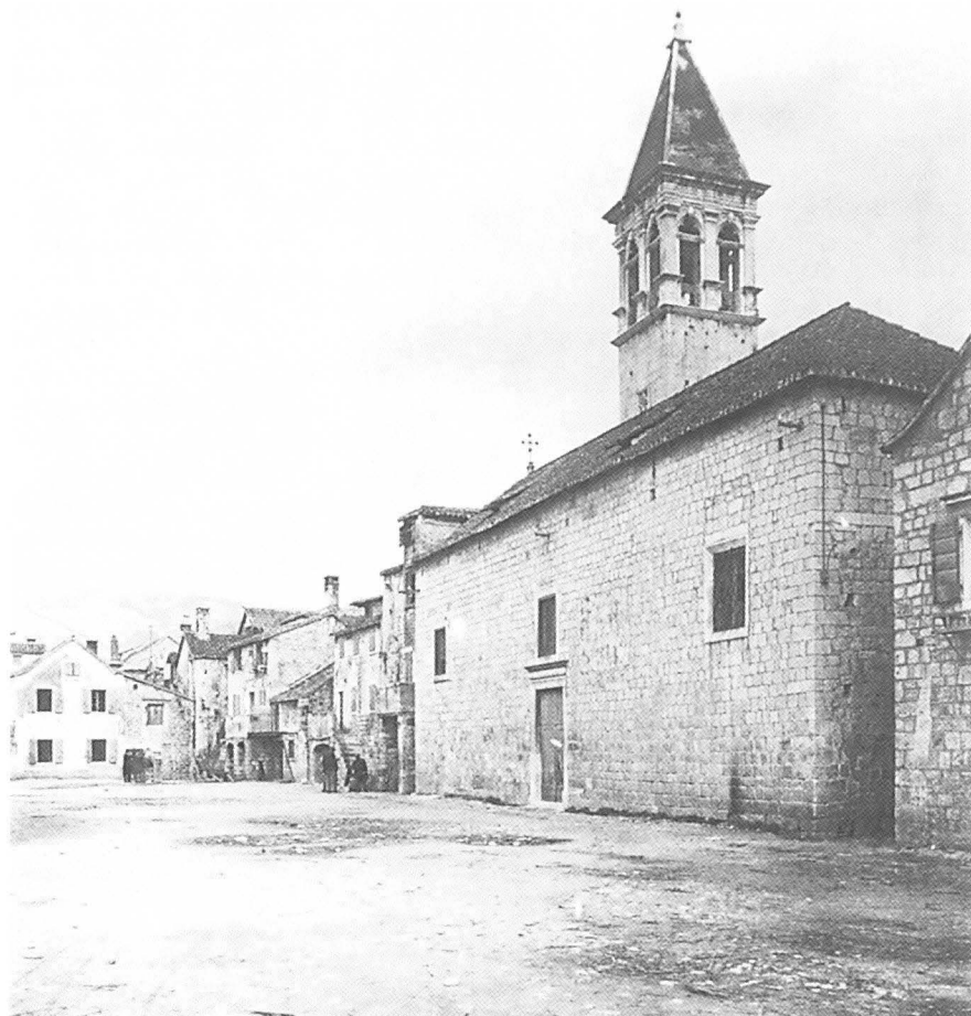
Stara fotografija zvonika i crkve sv. Mihovila u Trogiru prije rušenja

Sredinom XIX. stoljeća Trogirani su imali samo nižu osnovnu školu, te su djecu morali slati na školovanje u druga mjesta. U kolovozu 1858. godine općinska se uprava obratila Namjesništvu, a zatim i samom caru za pomoć. Upućena je molba da demanij dodijeli dobra bivšeg samostana sv. Mihovila za uspostavljanje više osnovne škole. 42 Carskom rezolucijom od 22. siječnja 1862. određeno je da se svake godine dodijeli općini pripomoć od 1000 forinta za održavanje glavne osnovne škole s četiri razreda. Bio je ustupljen ukupan iznos dvogodišnjih prihoda 1859-1860. za obnovu zgrade bivšeg samostana namijenjenog za novu školu. 43