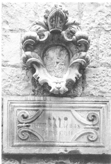
Natpis o obnovi 1752. godine s biskupskim grbom, samostan sv. Nikole, Trogir