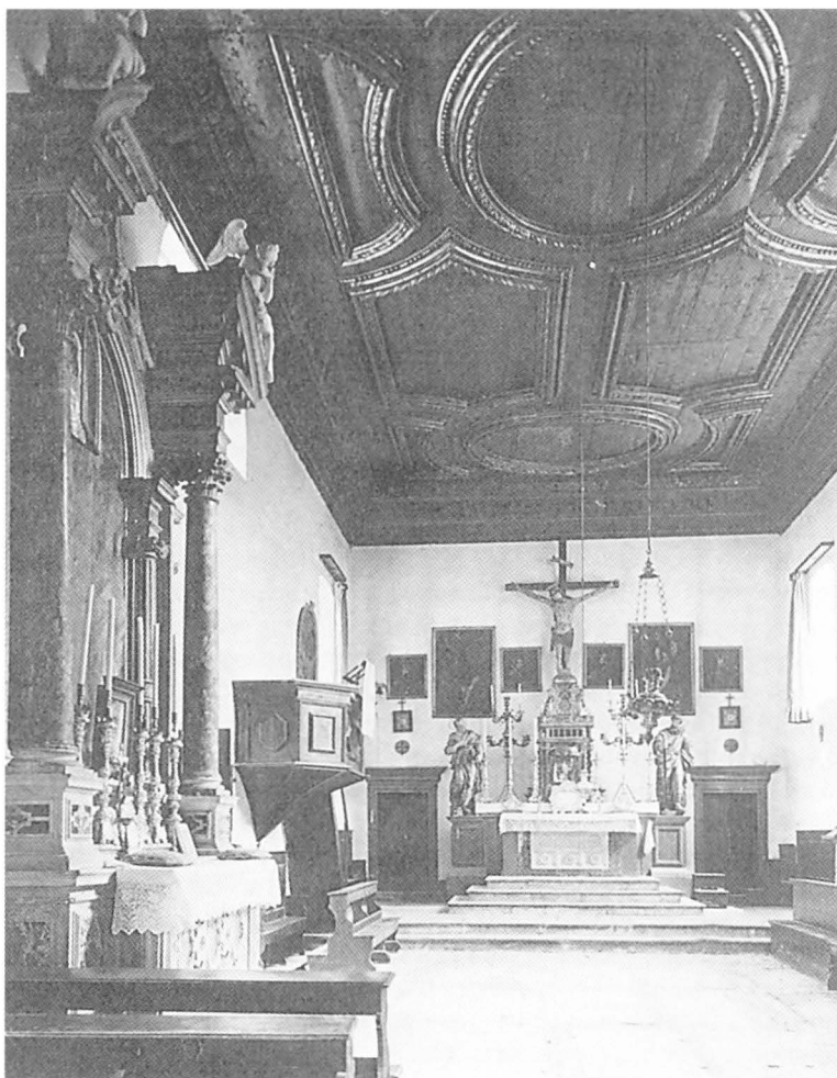
Izgled prezbiterija prije konzervatorskog zahvata, crkva sv. Petra, Trogir