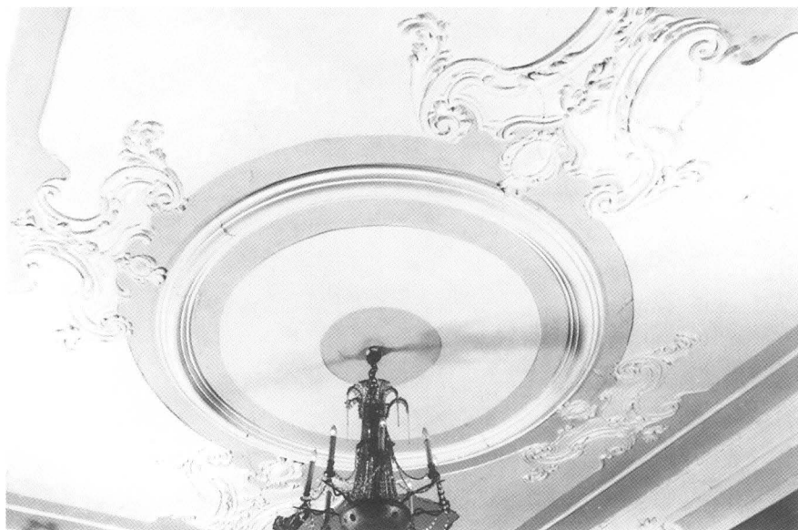
Nepoznati štukater XVIII st., Štukature u salonu palače Garagnin-Fanfogna, Muzej grada Trogira

ju brojne analogije s onima u unutrašnjosti trogirске benediktinske crkve sv. Nikole. 12 Sličnosti nalazimo u tipologiji ukrasa, primjerice u oblikovanju dekorativnih medaljona, modeliranju vitica i akantusa.