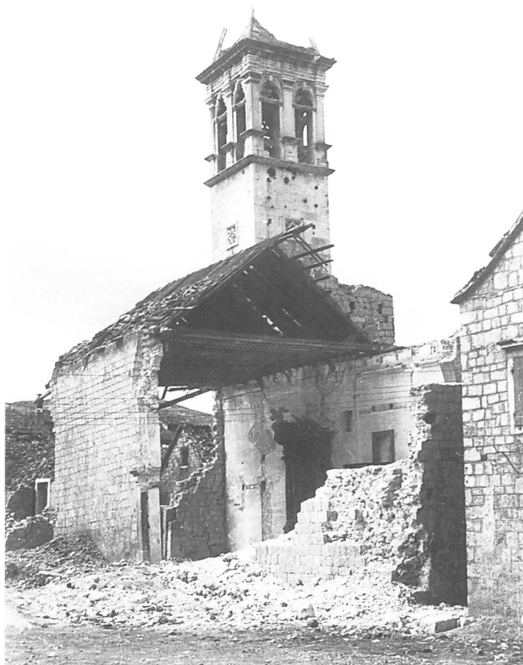
Stara fotografija bombardirane crkve i zvonika Sv. Mihovila u Trogiru

Crkva se protezala u pravcu sjever-jug, a uz njen sjeverozapadni ugao bio je zvonik. Danas je na tome mjestu nekadašnje crkve travnata parkovna površina.