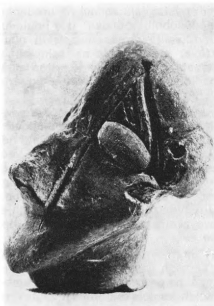
Glava antropomorfne figurine iz Supske kod Čuprije — Vinčanska grupa 4300—3100. godine p.n.e.

— Radno područje je zajedničko i ima obim regiona , što znači da svaki opštinski centralni muzej ima prava i obaveze da iz svog