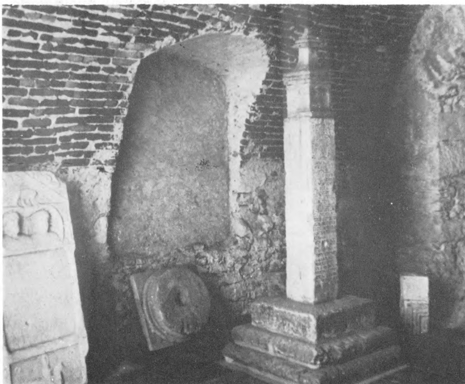
Lapidarij Gradskog muzeja u Varaždinu

volucije i Vidović mlin — više od 24 milijarde starih dinara.