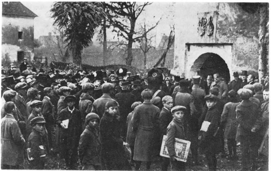
Otvorenje Gradskog muzeja u Varaždinu 1925. godine

»Značajno je, kako građanstvo Varaždina danas, kada je konačno nakon tolikih borbi i burne historije došlo u posjed Starog grada, taj Stari grad pretvara u muzej da sačuva svoje starine, pa da pokaže svijetu koliko je svijesno, da će poštovanju svoje prošlosti znati si zasnovati što veću budućnost« —