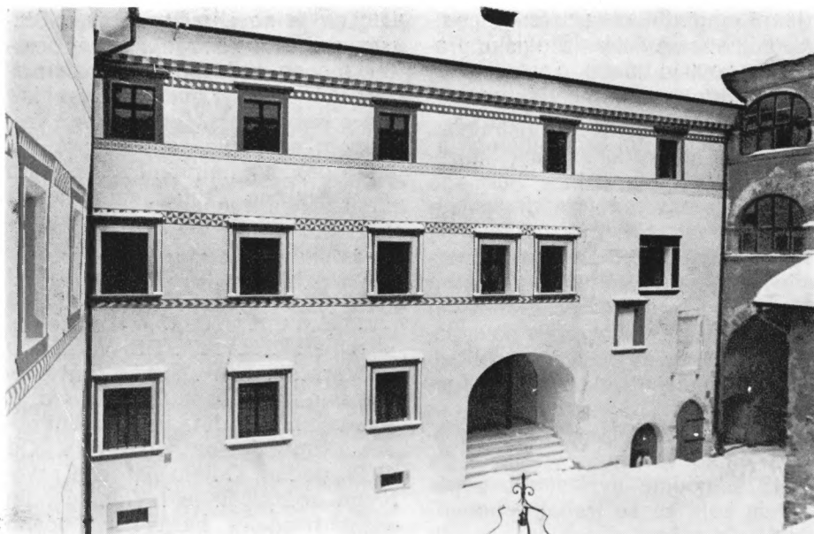
Obnovljena fasada sjevernog krila — dvorište Gradskog muzeja u Varaždinu. Obnova je dovršena do 16. 11. 1985. godine

kon potresa 1982. godine. Sa sanacijom Starog grada više se nije moglo odlagati, pa je Skupština općine Varaždin 1983. godine donijela odluku o usmjeravanju sredstava za sanaciju šteta od potresa i za Stari grad. Time je započela najveća obnova Starog grada. Kako je muzej već posjedovao idejni projekt obnove, Restauratorski zavod Hrvatske je pristupio izradi glavnih i izvedbenih projekata prema fazama. Do trenutka obilježavanja 60. godišnjice muzeja na Starom gradu izvedeni su slijedeći zahvati: obnovljeno je južno krilo, koje sada služi kao radni prostor kustosa Kulturno-povijesnog i Etnografskog odjela te uprave muzeja i uvedena je kompletna infrastruktura; zatim je obnovljeno zapadno krilo koje ima višenamjenske prostore, i to: izložbene, depo i stolarsku radionicu. Dvršena je velika zapadna kula koja je postavljanjem novog poda dobila dva velika izložbena prostora, a tavan je preuređen u depo. Najveće proširenje muzeja postignuto je obnovom sjevernog krila, gdje su po prvi put prostori podruma i tavana dobili funkciju. Četvrta faza obnove muzeja, a koja obuhvaća sjeverni obrambeni zid i istočnu kulu, započela je početkom 1986. godine. U toku ove godine dovršit će se izvedbeni projekti za još dvije preostale faze obnove grada: veliku gotičku kulu s mostićem (V faza) i južna kula s arkadama u dvorištu (VI faza). U toku sedme faze potrebno je urediti okolicu Starog grada. Ukoliko će i ubuduće