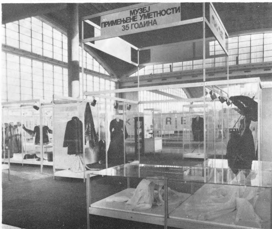
Izložba »Muzej primenjene umetnosti, 35 godina — mini muzej« u Beogradu