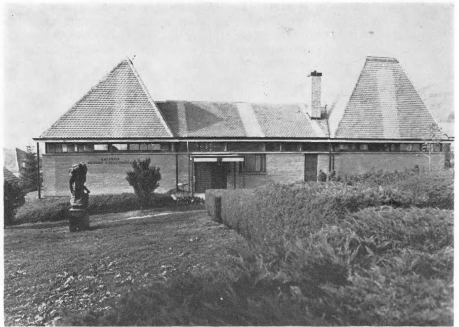
Zgrada u kojoj je smještena Galerija Antuna Augustinčića u Klanjcu

The new permanent display of the Museum of Applied Art is open to the public until February 1985.