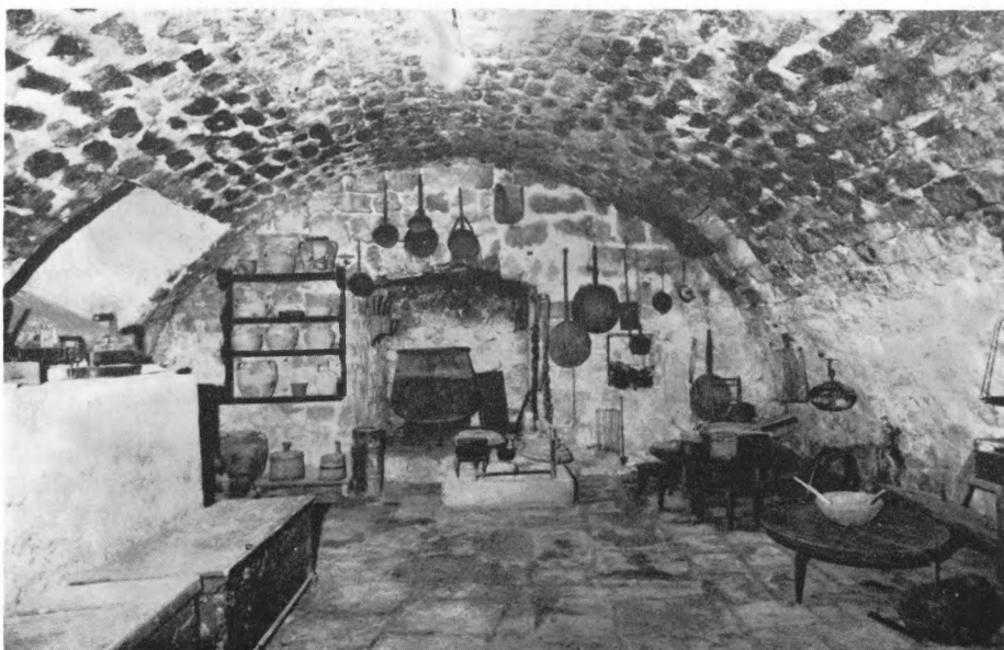
Dio etnološke zbirke u samostanu sv. Marije u Zaostrogu

Sačuvano je nekoliko predmeta umjetničkog obrta — srebrna kadičnica ukrašena kulama i tornjićima, srebrna gotička ladica te dva procesijska križa od pozlaćene mjedi. Tim predmetima, koji su vjerojatno radovi domaćih majstora (15. st.), pripada i ulomak veziva na kome je prikazana Madona s djetetom .