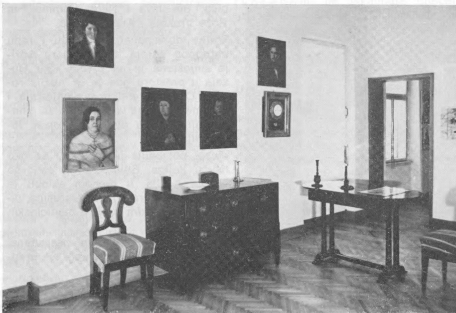
Detalj stalnog postava Muzeja Brodskog Posavlja u Slavenskom Brodu

bilarnu godinu obilježio svečano i radno s pojačanom izložbenom aktivnošću i izdavačkom djelatnošću.