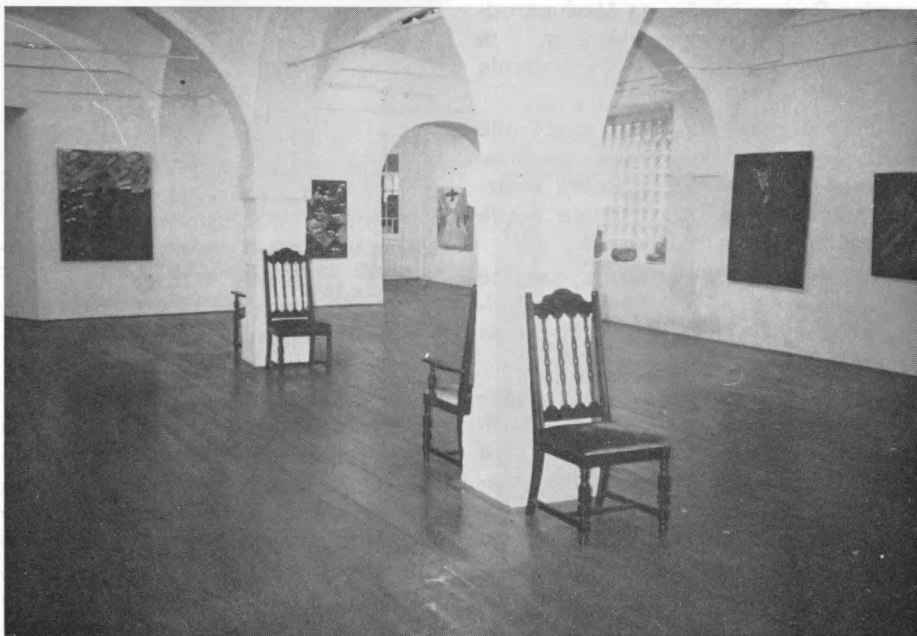
Galerija »Equrna«, Ljubljana

Izloženi su različiti predmeti upotrebne vrijednosti kao npr. naočale, torbice, igračke, foto-aparati, toaletni pribor, nakit i sl. načinjeni od plastike, u vremenu od sredine prošlog do sredine ovog stoljeća. To je vrijeme prve faze razvoja i upotrebe plastike kad se ona koristi kao zamjenski materijal za nedovoljne količine prirodnih sirovina: slonovače, ambre, roga, kornjačevine... Polovicom ovog stoljeća u industriji plastike dolazi do snažnog razvoja kad ona postaje samosvojan materijal koji više ne služi za zamjenu drugog materijala. Tada dolazi do potražnje za njim baš zato što ima svojstva kakva nema ni jedan drugi materijal. Na izložbi je predstavljena ona prva faza, tzv. »mlađe plastično doba« kad prevladavaju četiri osnovna materijala: parkezin, celuloid, galalit i bakelit. Osim