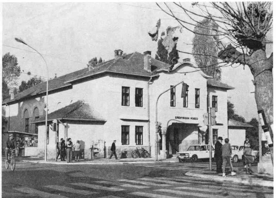
Zavičajni muzej Svetozarevo

Osnovna ideja stalne postavke je da se šira i naučna javnost može na jednom mestu upoznati sa istorijom i kulturom ovog područja od 5.500 godina p.n.e., kada se sa starčevačkom kulturom pojavljuje prva civilizovana delatnost, do tokova savremene istorije zaključno sa II svetskim ratom. Ovakvu potrebu nametnula je sama koncepcija Muzeja kao kompleksnog i regionalnog, kao i činjenica da do sada nije bilo sinteza u ovom obliku. Prilikom donošenja idejnog rešenja stalne postavke ukazale su se dve različite komponente koje je trebalo na odgovarajući način pomiriti. Na jednoj strani bio je integralni prostor od 600 m 2 visine oko 6,5 m, a na drugoj potreba da se jedan veliki vremenski period, koji obuhvata više od 7.000 godina, dokumentuje muzejskim materijalom na prikladan i pregledan način. Ovaj problem je rešen izložbenom konstrukcijom »Abstrakta«, kojom je izvršena planska podela prostora prema izložbenom materijalu na oko 30 celina-aneksa. Svaka od ovih celina na početku ima pano-tablu sa propratnim tekstom o određenom periodu. Problem osvetljenja je rešen