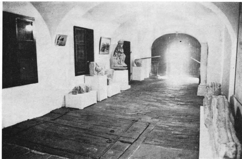
Detalj predvorja Muzeja grada Koprivnice

Izložba je zaista osvježanje u zgradi koprivničkog Muzeja, ali joj možemo postaviti i brojne primjedbe. Veći dio primjedbi povezan je s financijama, tj. s objektivnim nemogućnostima da se izložba postavi na moderniji način od ovoga. Jedan od prvih prigovora odnosi se na činjenicu da je postavljena u dvije prostorije koje »presijeca« dio etnografskog postava, pa nedostaje cjelovitiji dojam. U prvoj prostoriji postavljeni su prethistorijski nalazi. U vitrini 1 nalazi se kera-