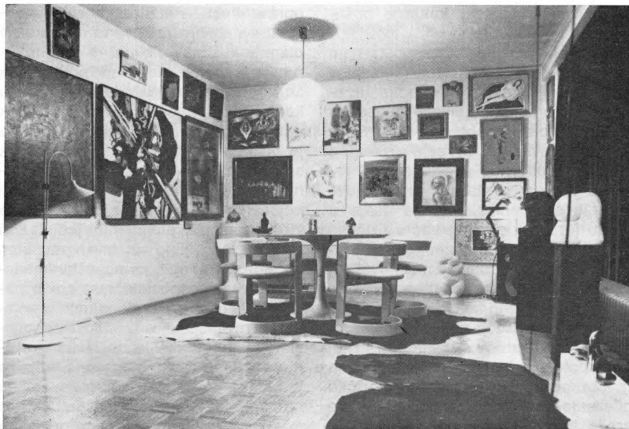
Dio privatne Zbirke Biškupić

Frangeš Mihanović, Ivan Meštrović... Čak kada se radi o suvremenim autorima, npr. Otonu Glihi, Edi Murtiću, radije se kolekcioniraju djela iz njihovih (nekarakterističnih) figurativnih i asocijativnih faza, nego iz apstraktnih. Mogla bi se učiniti daljnja ikonografska analiza koja bi pokazala da se radije kolekcioniraju pejzaži, mrtve prirode, portreti; da su najčešće u pitanju