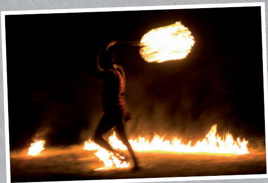
LUKA BRAJKOVIĆ, Vatra, 2009.