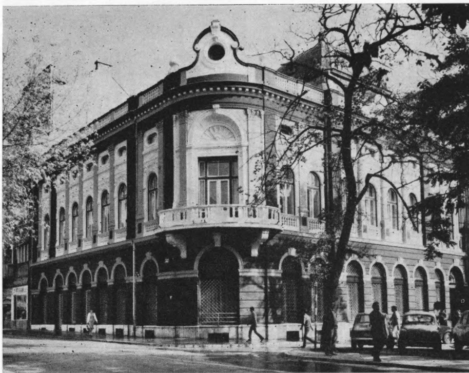
Zgrada Umjetničke galerije Bosne i Hercegovine u Sarajevu

— Izložbe se planiraju unaprijed, a onda se, nakon dobijanja sredstava, razrađuje detaljan plan i utvrđuje kalendar realizacije. Velike studijske izložbe