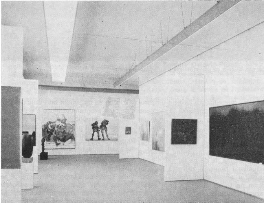
Dio stalnog postava Umjetničke galerije Bosne i Hercegovine u Sarajevu: Umjetnost Bosne i Hercegovine 1941—1981.

rade se uglavnom timski, a poslovi se uspješno koordiniraju, budući da u našoj kući, pored nekolicine najmlađih, djeluje i nekoliko historičara umjetnosti sa velikim iskustvom u svim vrstama muzejsko-galerijskih poslova. Isto tako imamo dobre odnose sa velikim brojem srodnih galerija i muzeja u zemlji i inostranstvu, iz čega proizlazi razmjena izložaba i uspješna suradnja na zajedničkim projektima.