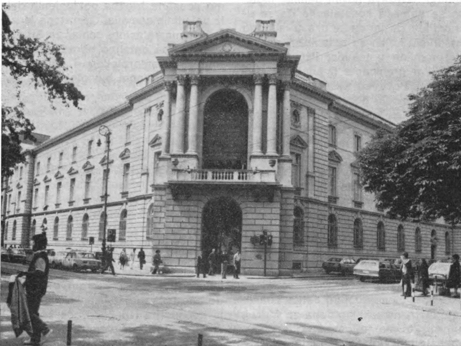
Zgrada Moderne galerije u Zagrebu neposredno nakon obnove fasade svibnja 1984.

Od 1970. postoji kontinuirani slijed retrospektivnih i tzv. monografskih izložbi najznačajnijih hrvatskih umjetnika starije i srednje generacije. To su one ključne izložbe koje bacaju svjetlo na cjelokupan rad autora i nezaobilazne su u kulturnom životu jednog naroda, u znanstvenom napretku povijesti umjetnosti i njenom napredovanju prema sintezama. Kao nacio-