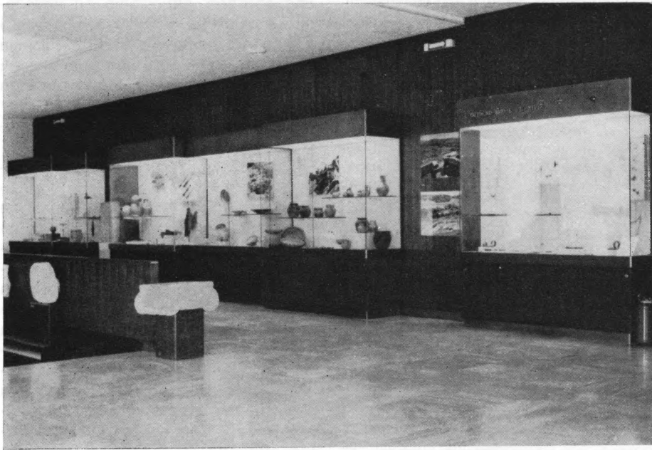
Dio stalnog postava Arheološkog muzeja Makedonije u Skopju

čke i foto-dokumentacije biti dostupan najširoj publici svih kategorija. Propagandno-pedagoška služba — kamernim, povremenim i tematskim izložbama, te napisima u štampi, na radiju i televiziji, organizovanjem naučnih skupova, filmskim projekcijama, predavanjima, recitalima i muzičkim priredbama — muzejsku postavku približuje posjetiocima svakodnevno. Postavka obuhvaća pet hronološki povezanih celina, na čije je oformljenje na izvestan način djelovao i sam arhitektonski prostor.