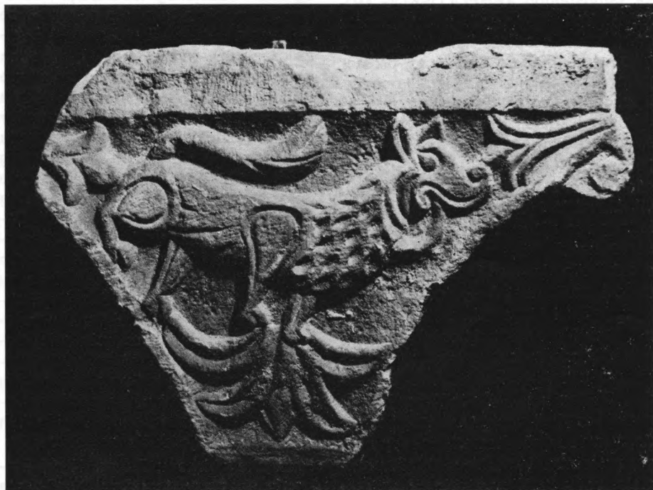
Arheološki muzej Zadar — Kapitel iz crkve Svete Nediljice (iz stalnog postava)

I prije osnivanja muzeja na području Dalmacije postoji zanimanje za spo-