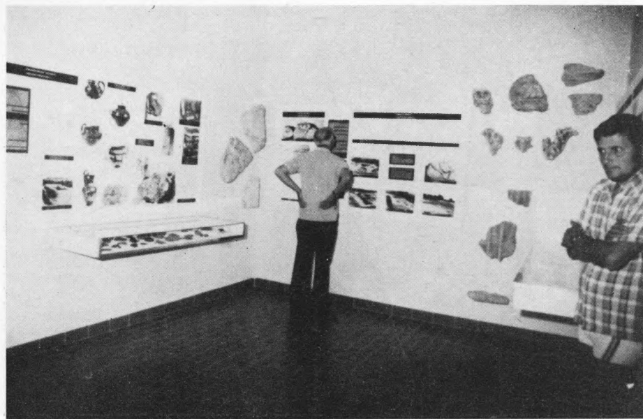
Detalj iz postava Muzejske zbirke Nezakcij

The Archaeological and National Museum of Zadar celebrated the 150th anniversary of their activities by presenting two large exhibitions — 150 years of the Archaeological Museum in Zadar (1832—1982) and National museum in Zadar 1832—1982. Above is a concise survey of the history of the two museums and their present activities.