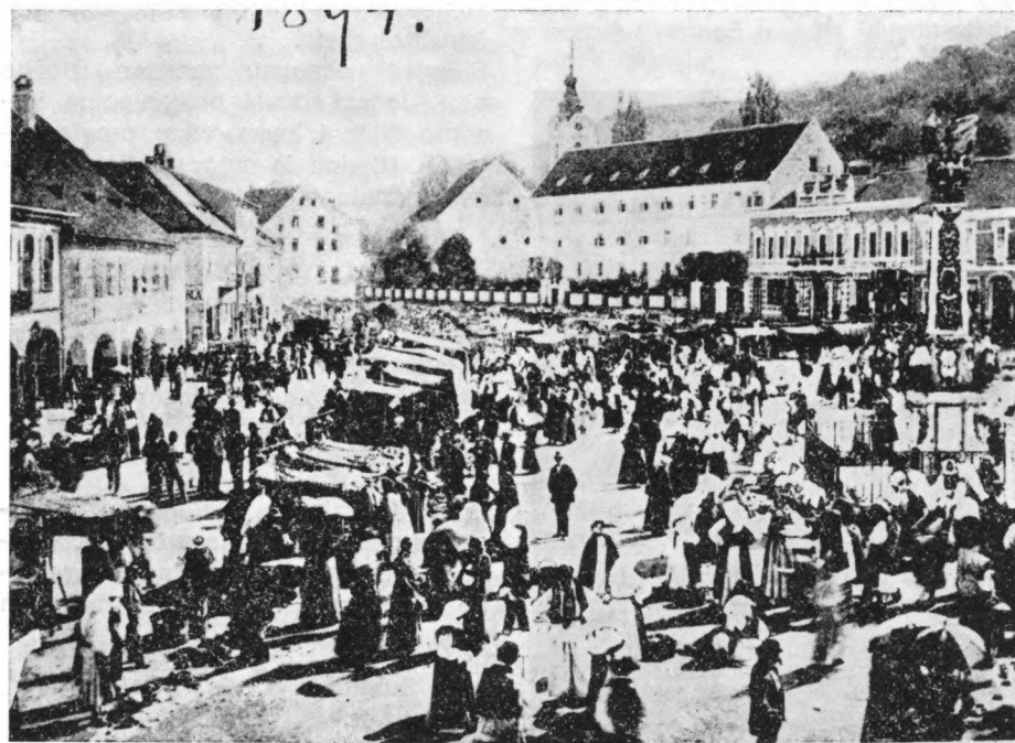
Terezijanski sajam na požeškom trgu oko 1894. godine. U pozadini jezuitski samostan i crkva sv. Lovre

Tako postavljajući problem, pitanje organizacije muzeja dobiva bitno drukčije konture. Muzej se sada pojavljuje kao institucija koja na najraznovrsnije moguće načine, koliko god dosežu njegove snage, nastoji utjecati na svoju