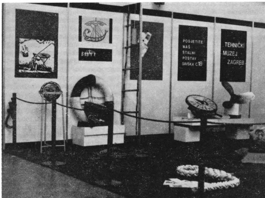
Detalj izložbenog prostora Tehničkog muzeja na međunarodnoj manifestaciji »Ferijal '83« u dijelu »Nautika«

koja su široj javnosti približena kao slikovni, pisani, ili, najčešće, kao tro-dimenzionalni materijal u vidu modela, maketa ili originala.