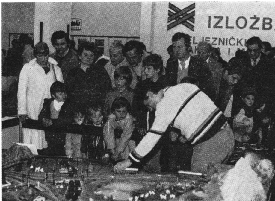
Sa izložbe željezničkih maketa i modela

Izložba je svojom temom a i koncepcijom privukla pažnju ne samo učenika osnovnog obrazovanja, kojima je bila i namijenjena, već i velikog broja djece predškolskog uzrasta, što i te kako mnogo znači za daljnji rad i razvoj Muzeja, posebice na planu posjetilaca.