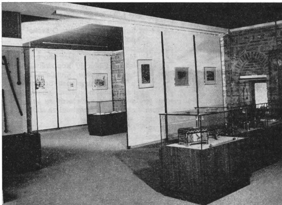
Dio postava Muzeja na Stara čaršija

Širina i iscrpnost radova poduzetnih na Muzeju, mislimo, opravdat će ga ako i svoju 25. godišnjicu proslavi iza zaključanih vrata.