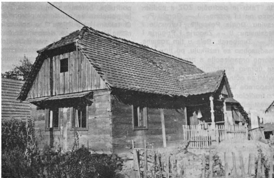
Osekovo 63 — Drvena prizemnica.

Etnološkim tumačenjem objekta, tj. objašnjenjem unutrašnje funkcionalnosti objekta, kao i tumačenjem razvoja cjeline kuće i pojedinih detalja uređenja i opreme, etnolog obrazlaže za-