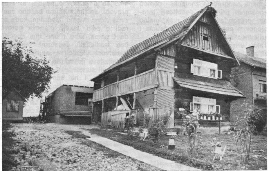
Kutinsko Selo — Kutina ul. Radićeva 108. Učestala pojava Novogradnja napravljena iza kuće prouzročit će rušenje starog čardaka.

U rujnu 1981. g. akcijom je bilo obuhvaćeno područje Moslavine; točnije, predviđenim planom obuhvaćene su četiri općine: Ivanić-Grad, Čazma,