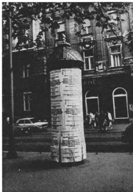
Izložba »Ulični namještaj« — informativni panoi