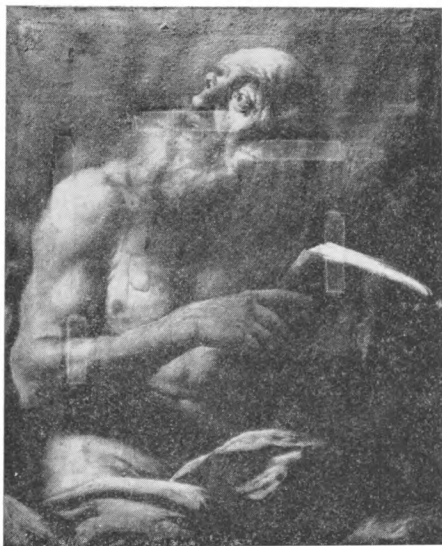
Nepoznati autor: Sv. Jerolim, 18. st. prije restauriranja

Na izložbi je prikazano 12 slika nastalih u periodu između 17. i 19. st., jedno drveno raspelo iz 18. st., i fotodokumentacija stanja umjetnina prije za-