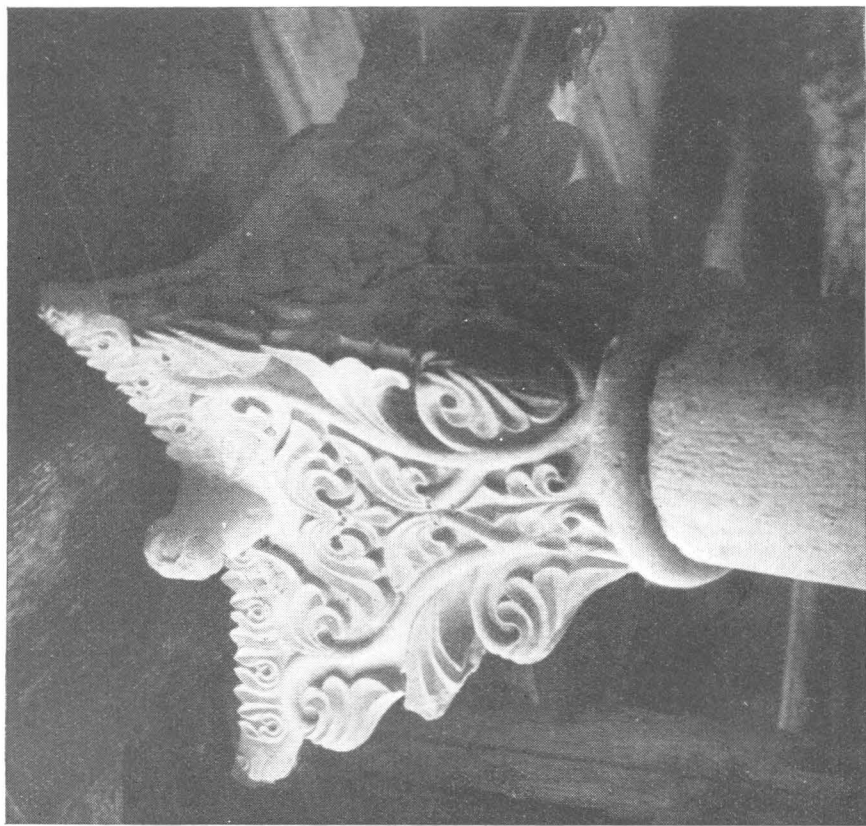
4. Glavica franjevačkog samostana u Ugljanu