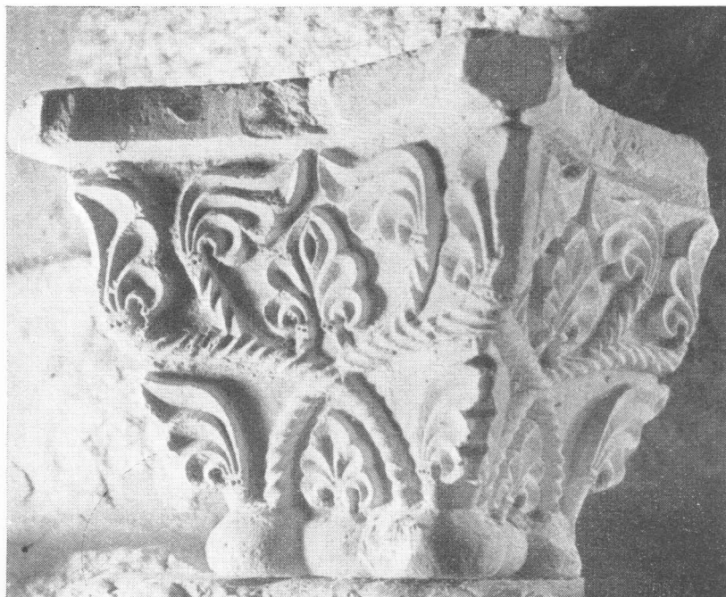
10. Glavica iz kapitula benediktinki u Zadru