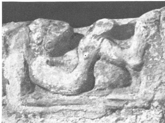
3. Konsolica u Arheološkom muzeju u Zadru