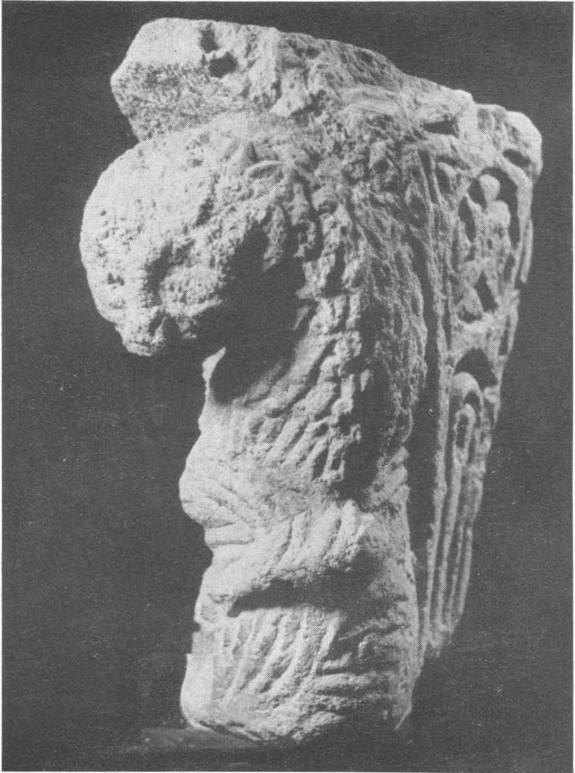
5. Konzolica u Arheološkom muzeju u Zadru