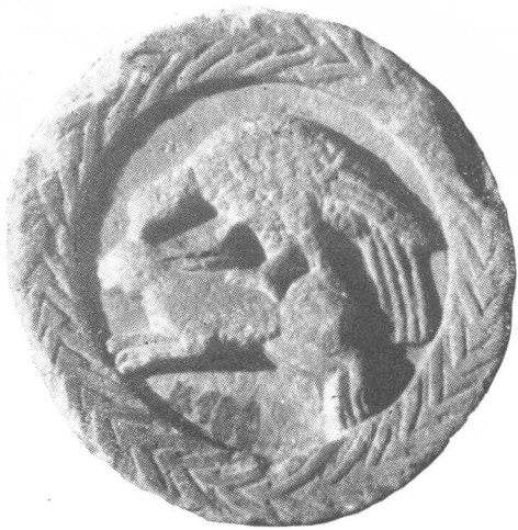
1. Reljefni medaljon u Arheološkom muzeju u Zadru