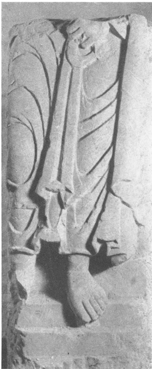
8. Ulomak reljefa u Arheološkom muzeju u Zadru