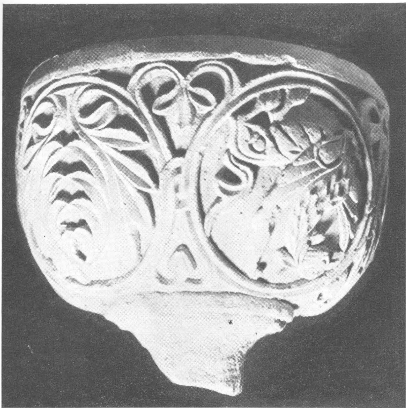
2. Stopa krstionice iz sv. Marije u Zadru