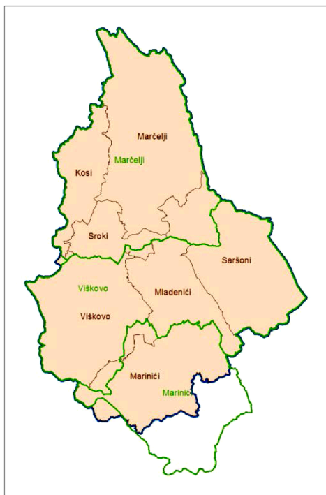
Slika 5. Općina Viškovo, administrativna i katastarska podjela.

U Područnom uredu za katastar Rijeka izrađena je detaljna analiza situacije, pri čemu je zaključeno da bi se spajanjem svih 7 naselja u jedno, naselje Viškovo (slika 6), prije svega stvorili uvjeti za pokretanje katastarske izmjere i osnivanje zemljišne knjige na području Marinića. Ne treba zaboraviti da se na području Marinića nalazi i velika poslovna zona te da bi usklađenost katastra i zemljišnih knjiga omogućila rješavanje mnogih problema građanima i poduzetnicima (URL 2).