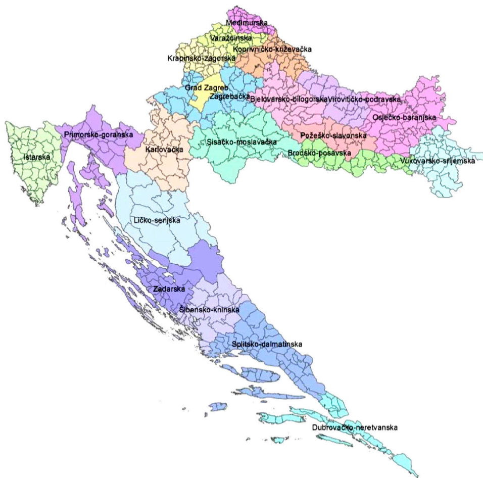
Slika 1. Pregledni prikaz županija, gradova i općina – stanje podataka na dan 1. siječnja 2015. (Državna geodetska uprava 2015).

Registar se dijeli na popise prostornih jedinica, grafički dio te zbirku isprava. U grafičkom dijelu Registra, granice prostornih jedinica vode se kao topološki obrađeni zatvoreni poligoni, odnosno prostorne jedinice iste razine pokrivaju cjelokupno kopneno ili ukupno područje Republike Hrvatske. Grafički se dio vodi i održava u GIS okruženju (slika 1). Uz granice prostornih jedinica obavezno se vodi izvor podataka (topološka karta, HOK ili katastarski plan).