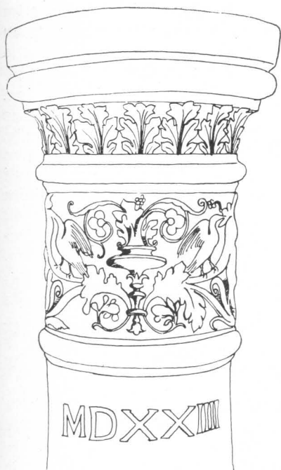
21. Ivan de Tollis: Ukrasi na topu za galiju