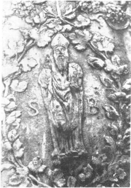
22. Ivan de Tollis Rabljanin: Reljefni ukrasi na zvonu gradskog zvonika