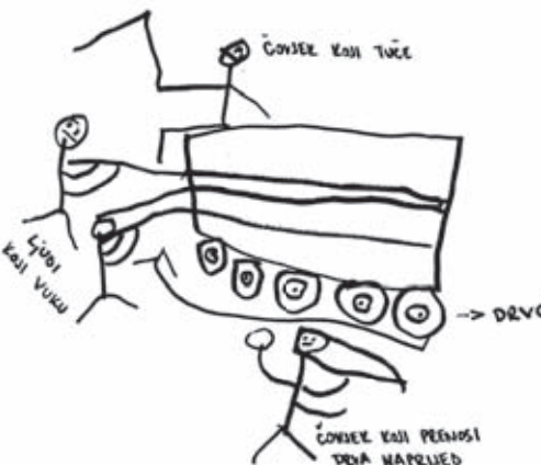
Grafički prikaz načina pokretanja vozila

prije do cilja, jer je teža pa se kreće brže. Hipoteza je potvrđena – Ana se spušta niz kosinu 5s, Nevija 6s.