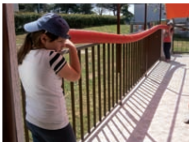
Istraživanje zvukova u cijevi