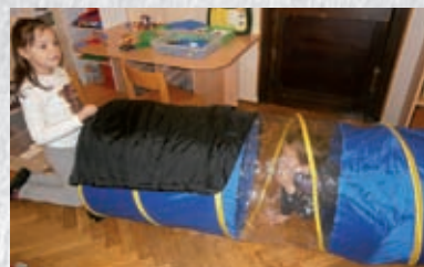
Deni M. (6,6 g.) i Hana M. (5,11 g.) pokušavaju zatvoriti ulaze u platneni tunel kako bi se unutra čula jeka

Istraživanje načina na koji riješiti ovaj problem nastavilo se i narednih dana, djeca su dolazila do raznih drugih ideja. No, smatramo da dobit za djecu ne proizlazi iz toga jesu li na kraju uspješna pomaknuti lastike ili ne, nego iz onoga što se događalo dok su zajedno tražili