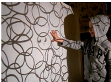
Projiciranje lastika na grafoskopu

To je kao kad smo u sobi – zvuk se odbija u zid zato jer smo u skroz zatvorenom, a kad bi možda bilo otvoreno ne bi se odbijalo i ne bi bila tako previše buka, nego bi otišlo vani. Isto, kad smo mi kući preuređivali moju sobu i kad je bila skoro prazna, onda sam ja glasno pričala i čula sam kako mi se odbija moj zvuk, glas, a ako staviš stvari na zidove onda se neće puno odbijati i neće biti buka.