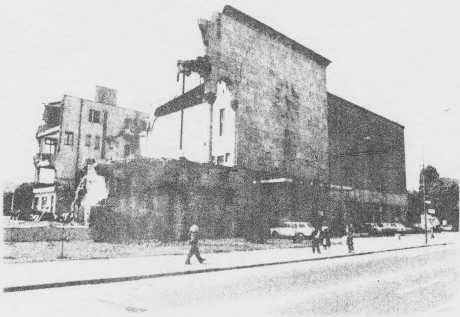
ZGRADA BIVŠE ŽELJEZNIČKE STANICE U SKOPJU KOJA JE ADAPTIRANA ZA MUZEJ GRADA SKOPJA