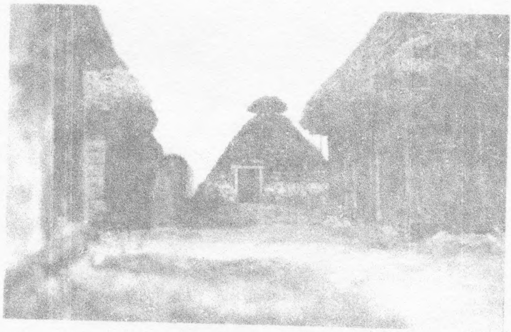
Narodni muzej Valjevo - izložba Modeli i makete