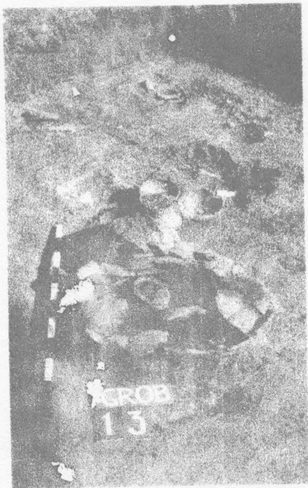
Halštatska nekropola kod Doroslava ( Sombor )