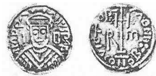
Pr. 6. Papa Adrijan I. (772. – 779.)