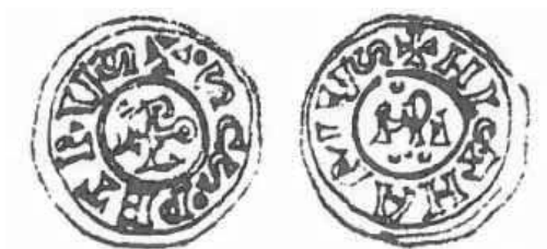
Pr. 7. Papa Leon IV. (847. – 855.)