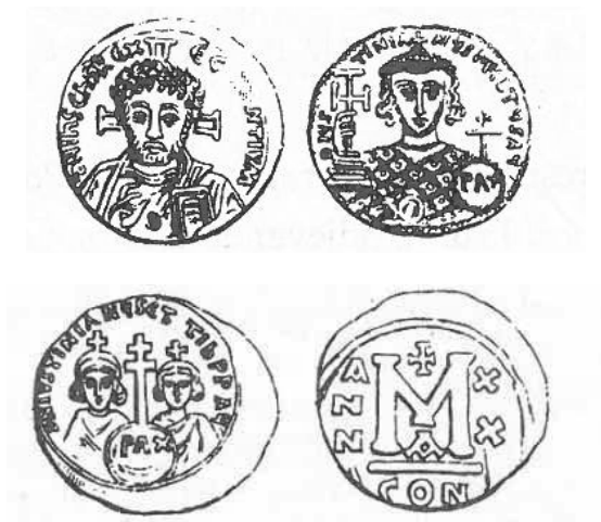
Pr. 8. Justinijan II. (druga vladavina), 705. – 711.