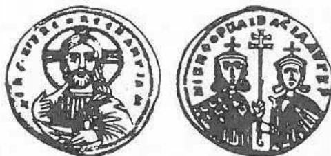
Pr. 9. Nikefor II. Foka, 963. – 969.