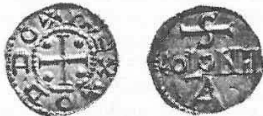
Pr. 1. Oton III. (983. – 996.)

Car Karlo Veliki (768. – 814.) epohalna je osoba. Uz skoro neprestano ratovanje, okružen je učenim ljudima svoga doba. Radi na unutarnjim reformama, posebice nakon što je osigurao mir i učvrstio položaj u savezništvu s papinstvom i Rimskom Crkvom. Ispunivši obećanje svoga oca papi, omogućio je 781. godine nastanak Crkvene Države. 9 Među ostalim reformama proveo je i novčanu. Deset godina pred svoje krunjenje za novog zapadnorimskog cara uveo je jedinstven srebrni novac peni , posebna izgleda i težine (1,705 gr.). Prednja strana imala je križ i Karlovo ime, a druga strana kraljev monogram i mjesto kovanja. 10 Nakon Karlove smrti Carstvo se počinje raspadati, a feudalci sve više jačaju. Upravo su feudalci, pored slabe središnje vlasti, težili kovanju vlastita novca.