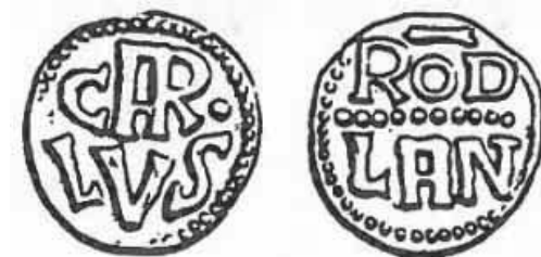
Pr. 3. Karlo Veliki (768. – 814.)