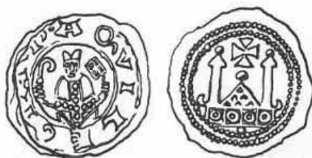
Pr. 5. Pelegrin II., Akvileja (1195. – 1204.)

Za pravnu uspostavu Crkvene Države prema Bizantu poslužila je Konstantinova darovnica . Iako krivotvorina, poslužila je u borbi za primat papinske vlasti nad svjetovnom vlašću. Crkvena Država potrajala je čak tisuću godina. Kao znak papinske vlasti, kovan je i papinski novac u zajedništvu s carem. Na novcu se s jedne strane nalazilo poprsje vladara, a s druge strane papinski monogram ili inicijali. Carske oznake ostajale su i nakon njegove smrti do početka vladanja novoga vladara ili su kovani samo pod oznakama novoi-zabranog pape, ako nije bilo vladara. Taj je običaj prekinut od 932. do 954. godine. U tom je razdoblju vlast u Rimu u rukama Alberika od Spoleta i on kuje novac bez pape. 13 Papinski se primat temelji na posebnom položaju Petra u Zboru apostola, stoga je poprsje sv. Petra najčešće na papinskom novcu.