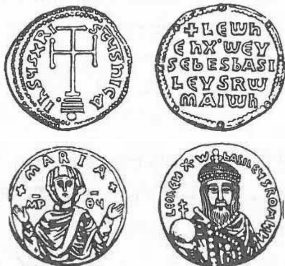
Pr. 10. Leon VI. Mudri, 886. – 912.

izazvao je pogrešan stav Zapada prema Drugom nicejskom saboru i Istoku. 16