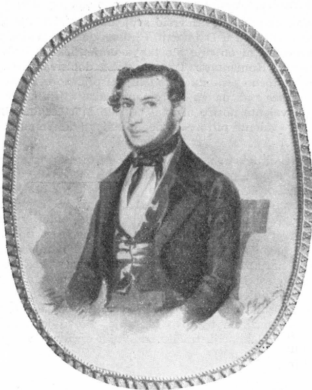
53. V. Poiret, Portret Definisa u Sutivanu

Iz toga se vidi, da je Poiret, ne uspjevši da se afirmira u Zadru i u Beču, već 1860. godine bio otišao u Trst i u Milan, ne napuštajući misao izdavanja dalmatinskog albuma. Prema pisanju N. d. D. neko vrijeme je poslije 1866. godine uređivao u Veroni demokratski list »L'Adige«. Umro je u Torinu u svojoj 55 godini, u ožujku