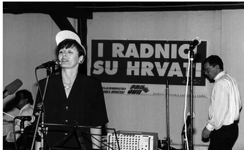
Slika 2. Skup SDH 1992.