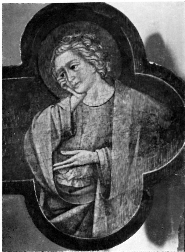
TKONSKO RASPELO (sam. Čokovac), detalji

tankim mlazevima koje slikar izvodi vrlo virtuozno. Ističe se krv koja pada na Adamovu lubanju.