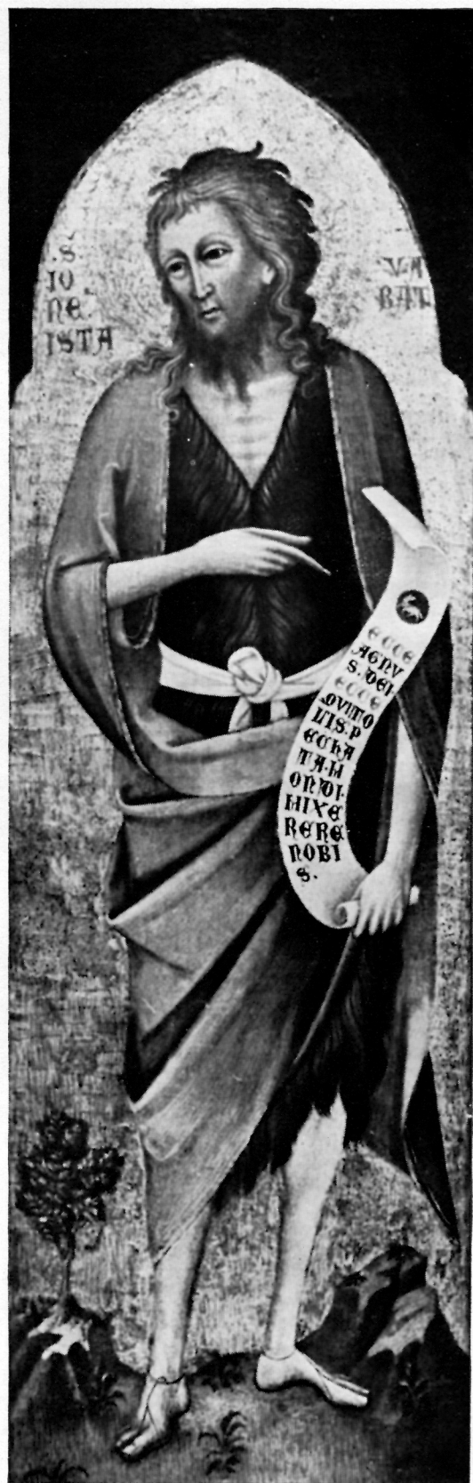
Manastir sv. Arandela na Krki, Sv. IVAN KRSTITELJ