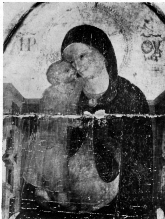
LIK BOGORODICE na poliptyhu iz Šibenika