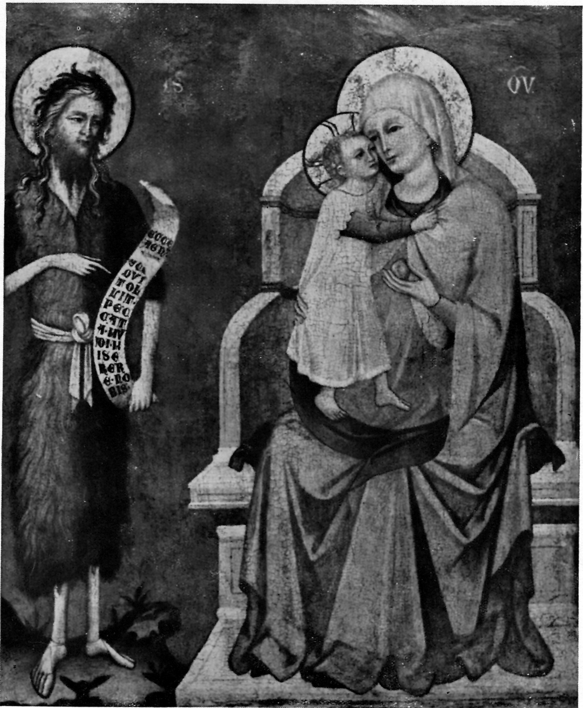
Franjevački samostan u Kraju (o. Pašman), GOSPA S DJETETOM i sv. IVAN KRSTITELJ (nakon restauracije)

sv. Krševana, sv. Ivana Krstitelja, sv. Mateja i sv. Grgura, sve pokrivene srebrom... 10 Kad je u crkvu sv. Stjepana god. 1632 prenesen sarkofag sv. Šimuna i postavljen na glavni oltar, 11 poliptih je maknut. God. 1641. izrađen je poseban oltar za Varošku Gospu. Sačuvana je samo Bogorodičina slika i slike sv. Mateja i sv. Jurja