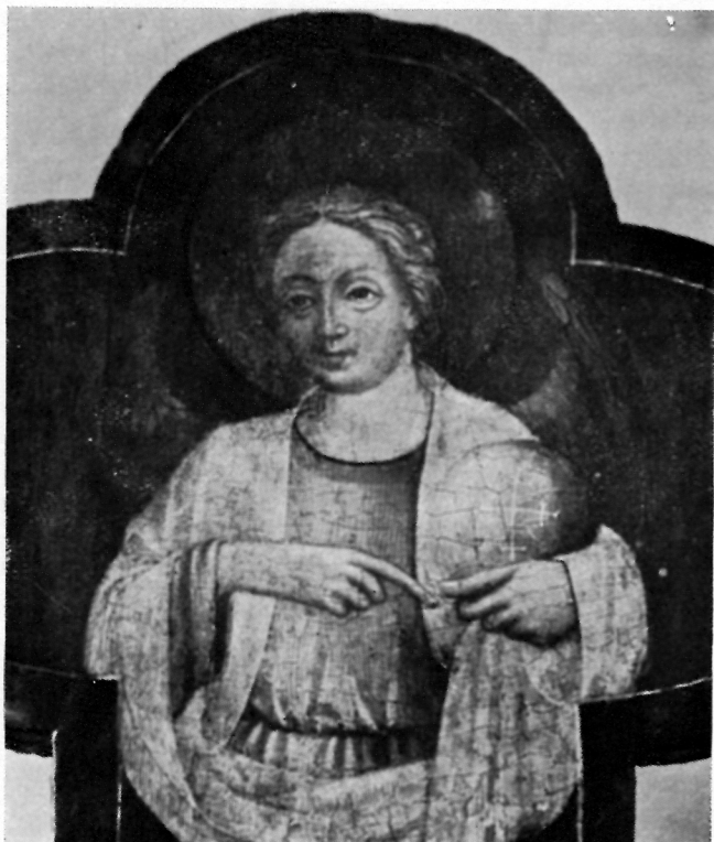
LIK ARHANDELA na Tkonskom raspelu