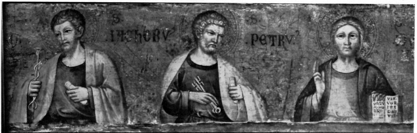
London, National Gallery »Maestro di San Elsino«, POLIPTIH, LIKOVI U PREDELI.

Dakako da takve hipoteze nemaju naročite osnove, ali u ovom času kad tek počinjemo razrađivati tu novu slikarsku ličnost, smiju se iznijeti. Dalji studij iznesenih problema neće se smjeti obavljati samo na terenu umjetničke analize nego i na arhivskom radu. Mi za sada ne raspoložemo podacima iz arhiva gradova sa suprotne jadranske obale, a upravo bi ti podaci morali imati odlučujuću riječ u hipotezama koje sam ovdje iznio.