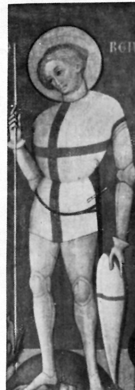
Crkva sv. Šime u Zadru, TRIPTIH VAROSKE GOSPE