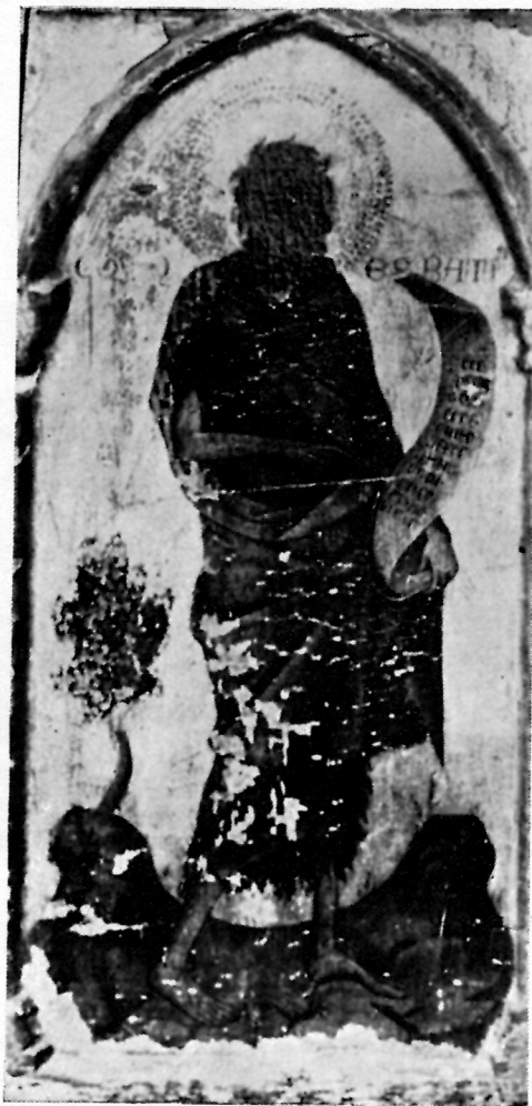
Lik sv Ivana na poliptihu iz Šibenika

Ivana u Krki. Male kompozicije na krilima tog poliptiha pokazuju također niz elemenata za komparaciju s našim slikama: modelaciju likova i nabora, fizionomije, aureole obrubljene crno, crne tanke linije na detaljima, rukopis natpisa, arhitekturu s polukružnim lukovima. Posebno upozoravam na srodnost u modelaciji stjenovitih pejzaža na tim slikama i stijene na podnožju križa na tkonskom raspelu odnosno stijene pod Ivanovim nogama na slikama u Kraju i Krki.