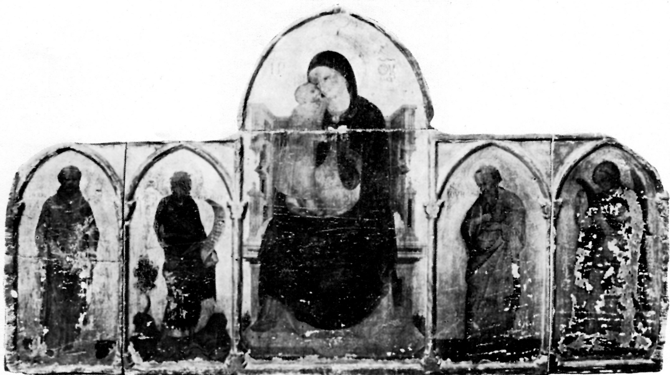
IZGUBLJENI POLIPTIH IZ ŠIBENIKA

njom desne ruke pokazuje na nj. Dok u modelaciji desne ruke ima nekih neznatnih razlika, rotulus i lijeva ruka potpuno su jednako naslikani. Rukopis natpisa je potpuno isti s karakterističnim oblikom slova M, dok se tekst nešto razlikuje: ECCE · AGNVS · DEI · ECCE · QVI · TOLIS · PECHATA · MONDI · MIXERERE · NOBIS. Poviše natpisa naslikan je mali »Agnus Dei« kojega nema u Kraju. Riječ »ecce«, koja se javlja dvaput, napisana je crvenom bojom što također manjka na slici u Kraju. Platneni opasač jednako je slikan, ima neznatnih razlika u uzlu. Očita je sličnost u karakterističnoj modelaciji nogu i sandala i u stjenovitom stiliziranom pejzažu. Dolje, lijevo od Ivana, vide se ostaci nekog stabla, po čemu se ta slika približava slici Ivana na izgubljenom šibenskom poliptihu. Razlika postoji između lica Ivana u Kraju i lica Ivana u krčkom manastiru. No ta je razlika prividna. Ivan u Kraju je prikazan namršten, pa su mu oči rastegnute a i proporcije lica su se pomalo izmijenile. Sličnost fizionomiji Ivana u Krki lako je naći na drugim opisanim slikama. Tanke crne linije o kojima je bilo riječi prisutne su i ovdje modelirajući oči i usta i obrubljujući jedva primjetljivo lijevu ruku. Ne treba posebno isticati tanke niti sandala, koje su na isti način naslikane kao na slici u Kraju. Općenito uzevši slikarska faktura i tonalitet boja ni po čemu se ne razlikuju od ostalih slika što nas logično navodi da ovu sliku pripišemo istom slikaru.