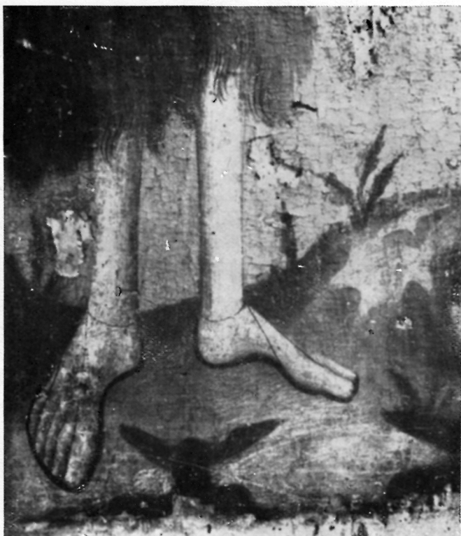
DETALJI LIKA SV. IVANA KRSTITELJA NA SLICI U KRAJU (prije restauracije)