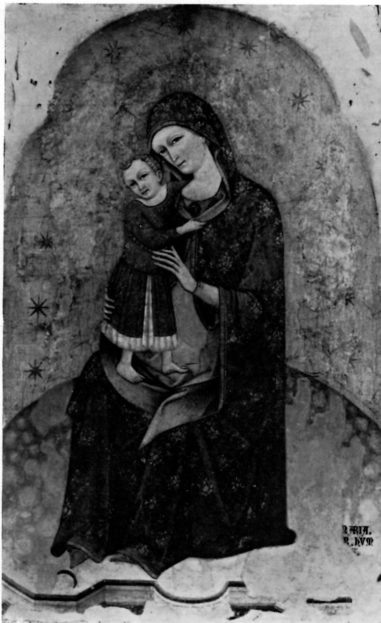
London, National Gallery, »Maestro di San Elsinco«, POLIPTIH — središnji dio.

Slikar Ivan iz Padove (Iohannes quondam Tomasini de Poglana — ili Poveglana — de Padua) spominje se u pet dokumenata. Ugovori od 20. I i 3. II 1384. spominju njegovu obavezu da će u samostanskoj crkvi sv. Dimitrija popraviti oltarnu sliku. Ugovorom od 29. IX 1385. uzima u nauk mladog Dubrovčanina Iliju nečaka Zadranske Radoslave. Na dan 21. X iste godine naručio je Ratko, kapelan crkve sv. Mihovila u Trnavi ninske biskupije, od njega drveni poliptih po uzoru na poliptih sv. Jeronima u zadarskoj crkvi sv. Dominika (Platona). Dana 21. V 1386. obavezao se slikar plemiću Bartolu Zoilovu izraditi poliptih koji će taj plemić darovati crkvi sv. Marije Velike.