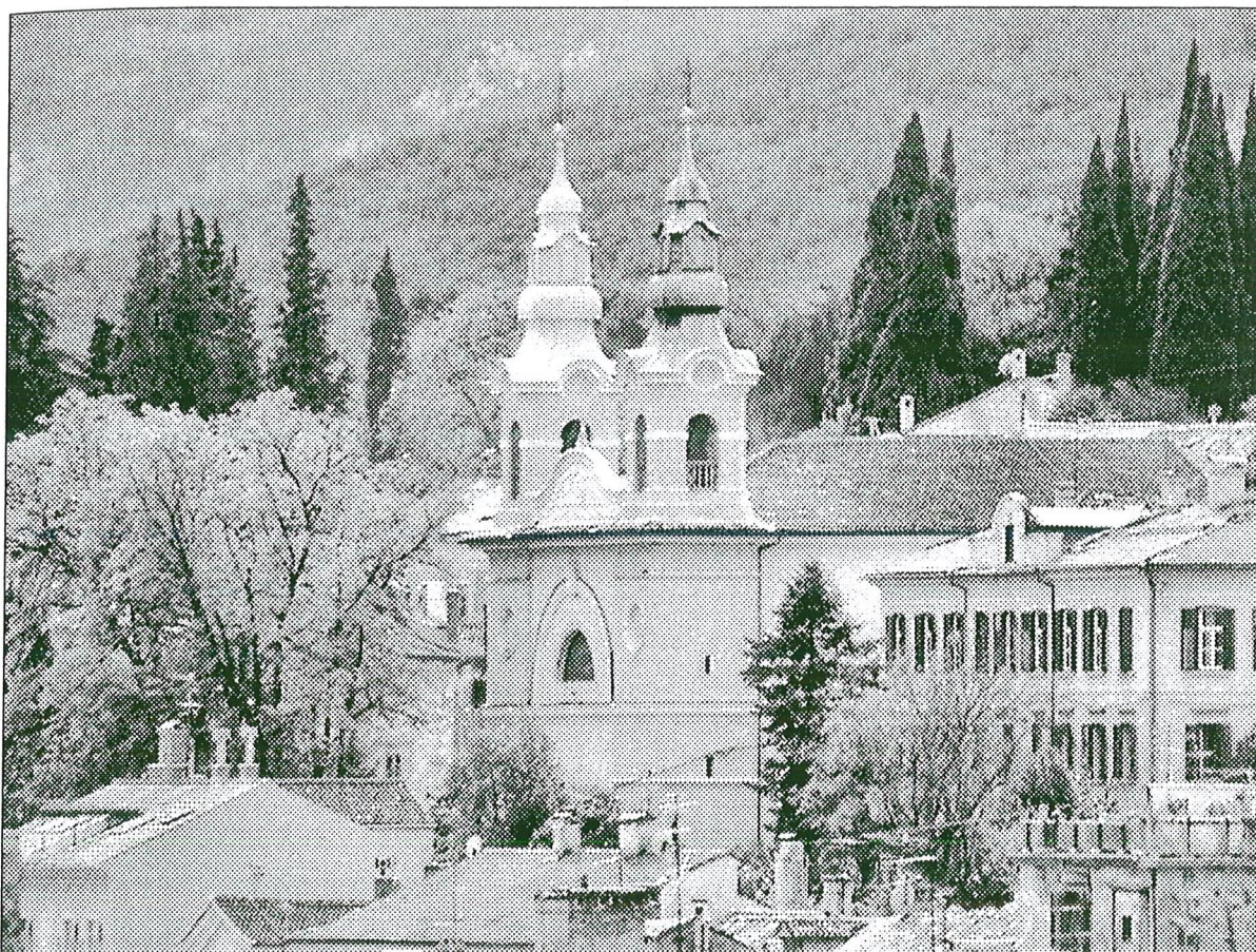
Crkva sv. Ane ( www.volosko.com.hr )

se prvi put spominje u povijesnim vrelima, predstavljala je izlaz na more grada Kastva, odnosno njegove istoimene gospoštije 5 . Tijekom Uskočkog rata (1615.-1618.) preko Voloskog su se senjski uskoci opskrbljivali žitaricama i vinom iz Istre, zbog čega ga je tada opljačkao i spalio mletački kapetan Antonio Civran 6 .