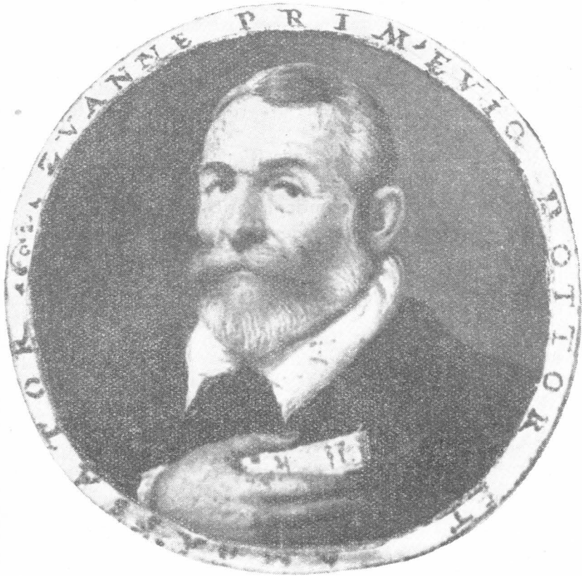
26. Minijaturni portret Dr. Ivana Primojevića sa Omiške dukale

U središtu gornjeg dijela bordire oslikan je medaljon s grbom Venecije. Na modroj pozadini pozlaćeni krilati lav zatvoren je u valovitom okviru. Predstavlja centar događaja, zapravo lokalitet, gdje se radnja zbiva. Prema lijevoj strani vrpca prolazi kroz grupirano oružje: renesansni oklop po uzoru na antiku, okrugli prsni štiti, tobolac sa strijelama, pernati buzdovan, dvije puške po obliku kolašice. Sve je to ukrašeno biljnim viticama i povezuje se na ugaoni medaljon, u kojemu je prikazan u obliku parabole, na modroj pozadini, pozlaćeni most s tri tornja. Nad pozlaćenim okvirom medaljona naslikana je duždeva kapa (corno). To je grb dužda Nicolò De Ponte, dakle ličnosti u čije se ime izdaje povelja. Patricijska obitelj De Ponte ostvarila je vlastitim imenom simbolični grb.