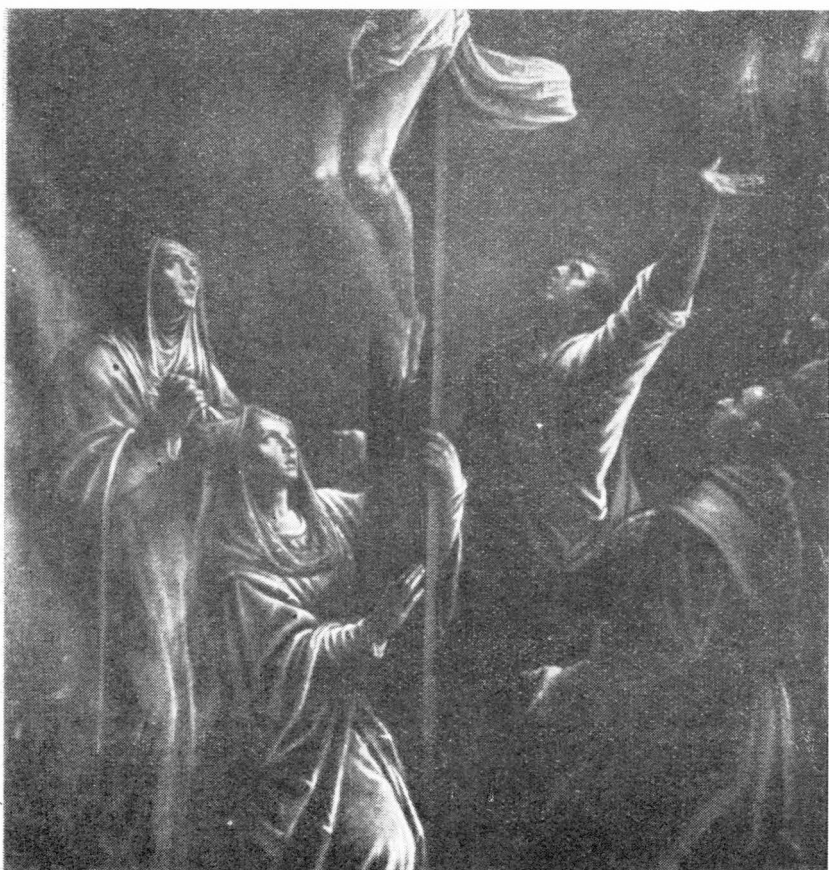
44. L. Bassano, Detalj Raspeća iz franjevačke crkve u Hvaru