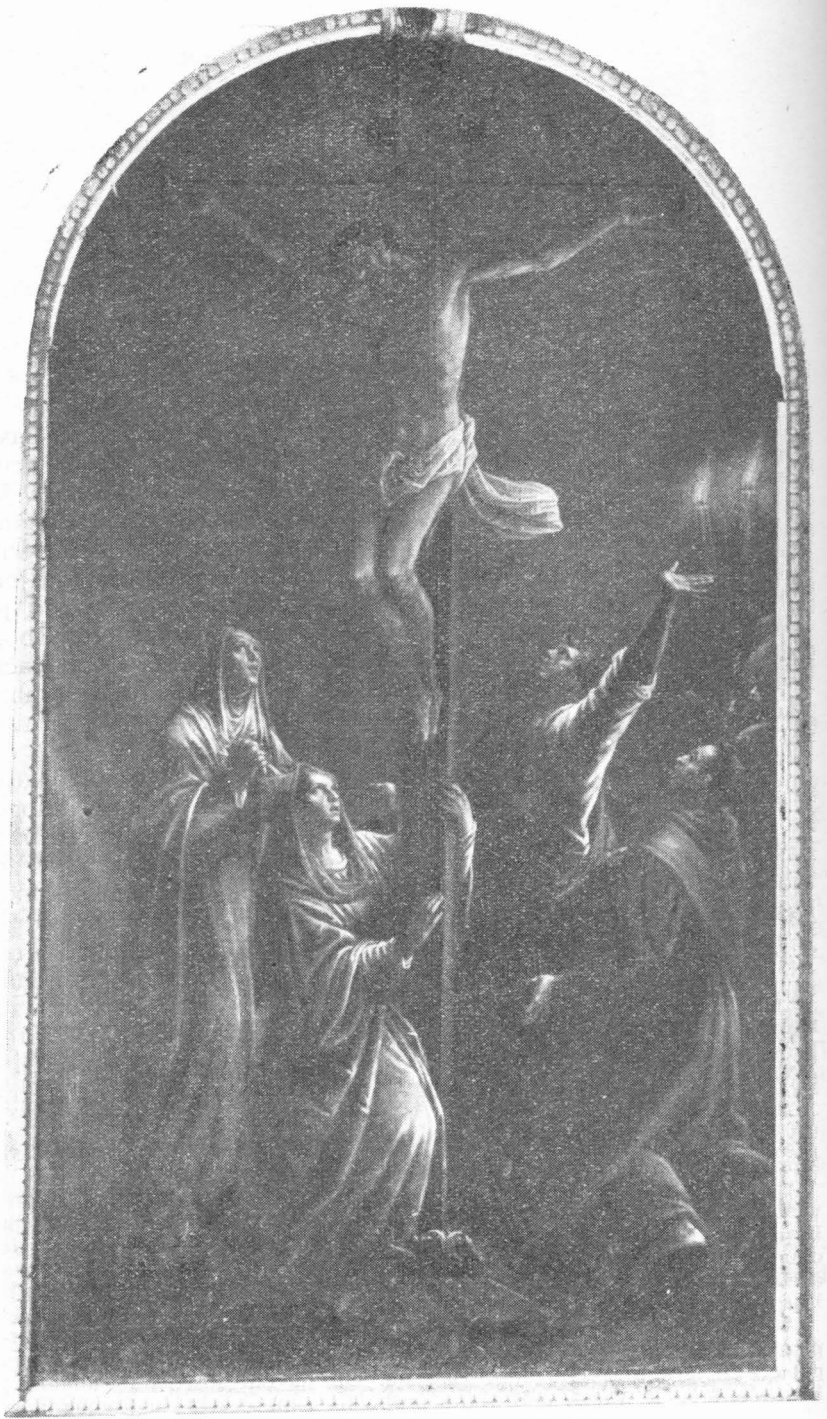
43. Leandro Bassano, Raspeće iz franjevačke crkve u Hvaru