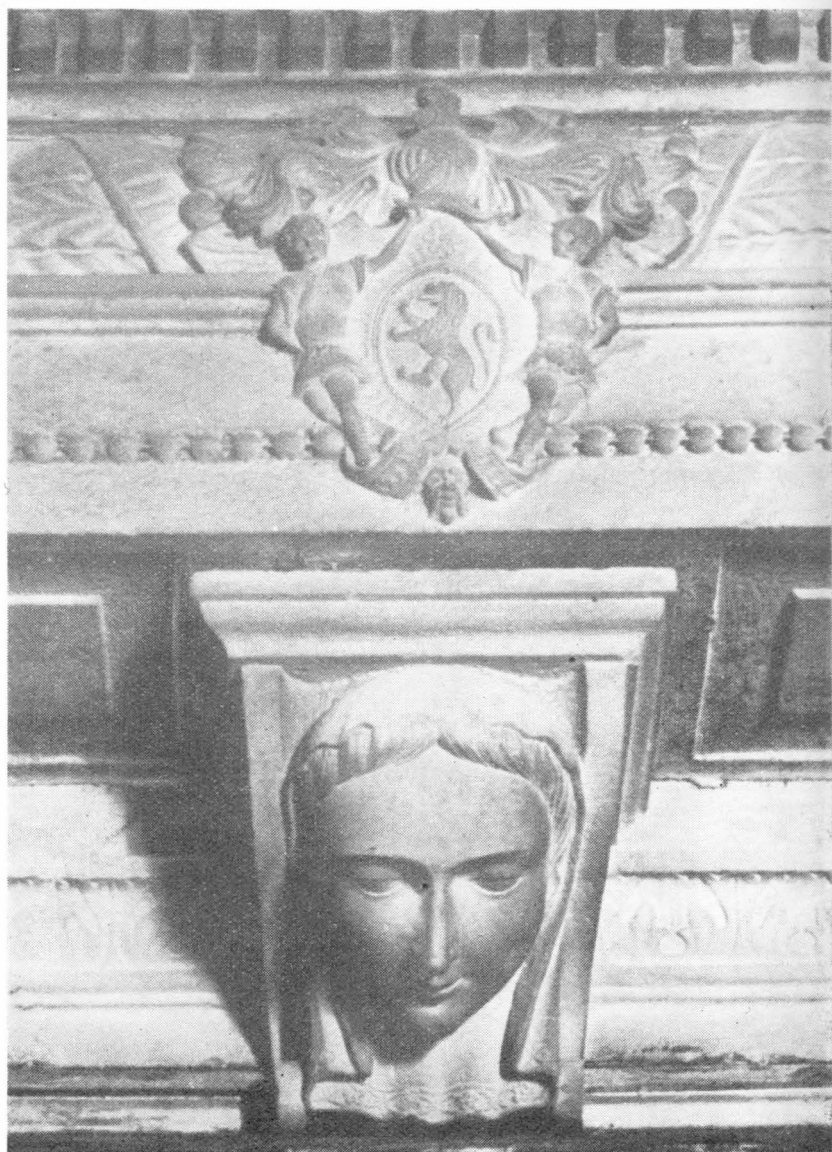
52. Detalj Bokaničeva oltara