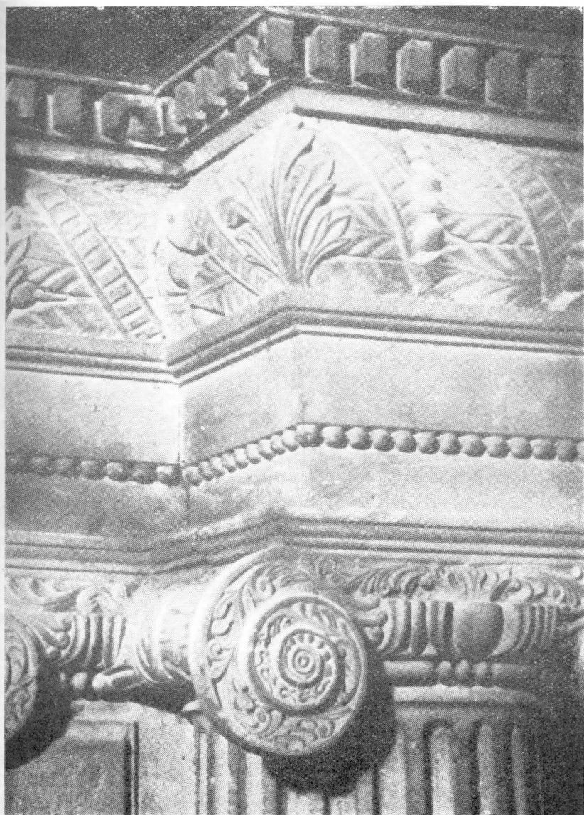
51. Detalj Bokaničeva oltara