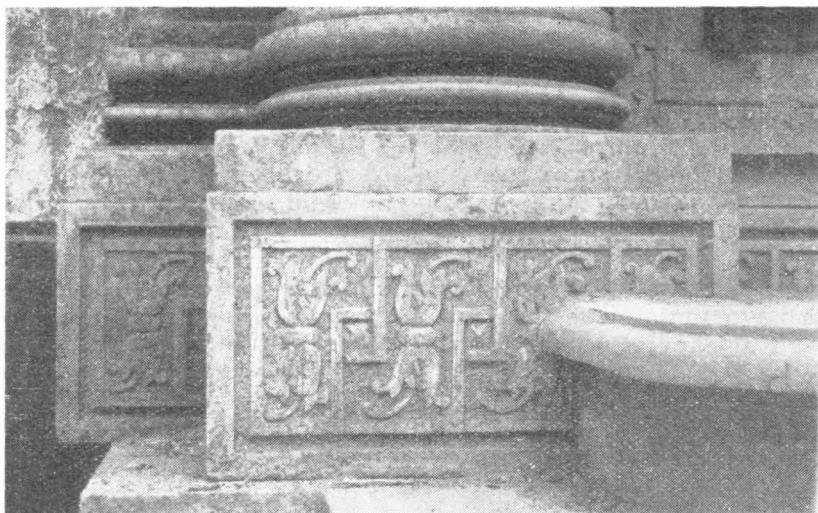
53. Dio podanka Bokanićeva oltara

u Dalmaciji tog vremena. Ukraas je posvuda oštro rezan, ponegdje, kao na volutama kapitela, usitnjen, što je tipično za ukus provincijskog majstora i traženju naručitelja. Prelomljeni zabat, obličasti jastuk na arhitravu i konzola sa ljudskom glavom — inače ključni kamen luka, a ovdje nestrukturalno upotrebljen — već su elementi, koje će kasnije barok upotrebljavati kao svoju osobitost. Po tome ovaj oltar stoji na prelazu iz renesanse u barok, te svojom zamisli i oblikom ide u korak sa sličnim ostvarenjima u susjednoj Italiji. Oltar bi se stoga mogao datirati oko 1600. godine, u vrijeme Bokanićeva rada u Trogiru, kad je, svojom zamisli renesansnog završetka zvonika katedrale, izmirio oblike gotike i renesanse u skladnu cjelinu.