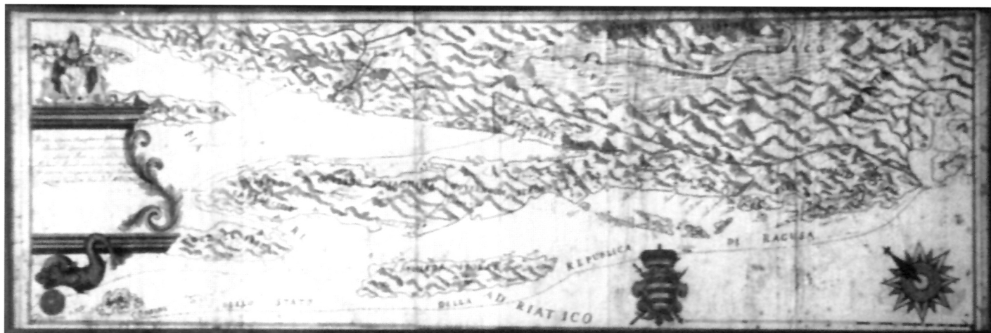
11. Karta Dubrovačke Republike iz 1746.