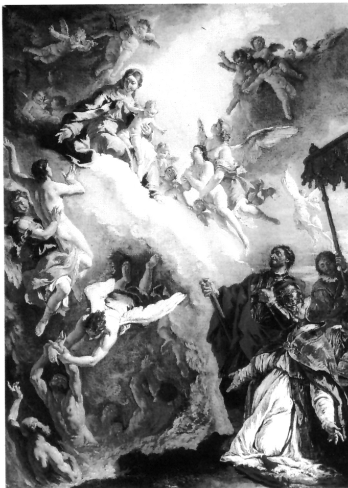
6. Francesco Fontebasso, Papa Grgur Veliki i Sv. Vital mole Bogorodicu za pomoć dušama čistilišta , Beč, Kunsthistorisches Museum