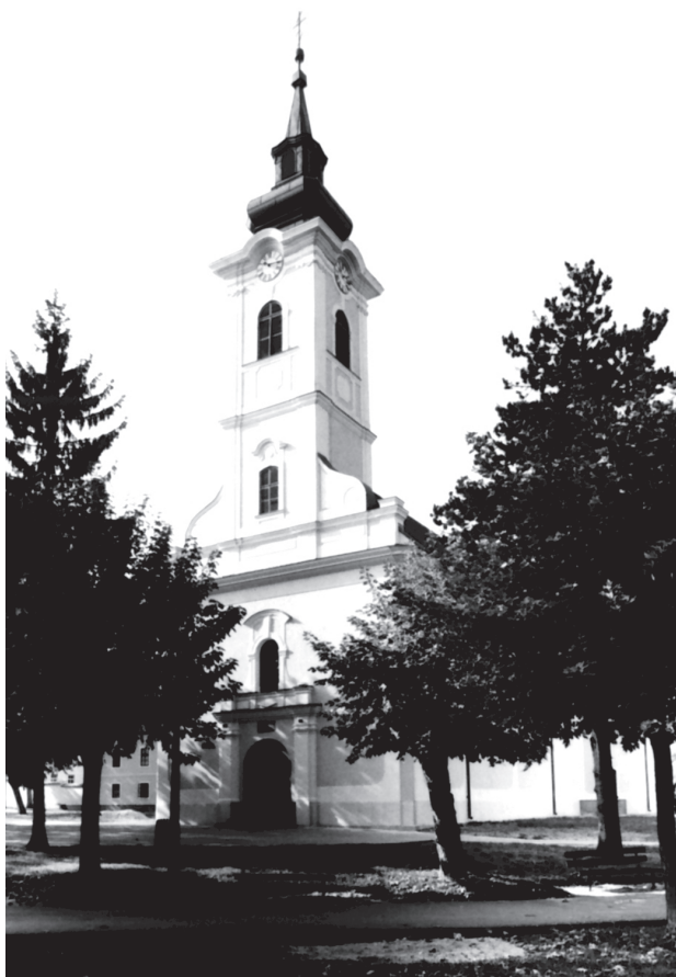
Petrinja, župna crkva sv. Lovre, rekonstruirana nakon Domovinskog rata / Petrinja, parish church of St. Lawrence reconstructed after the Liberation War