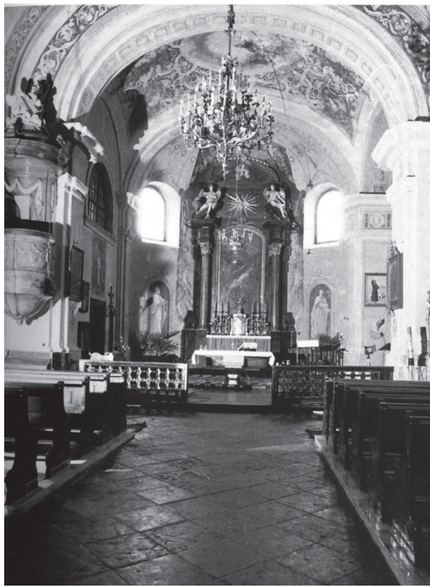
Petrinja, župna crkva sv. Lovre, oltar sv. Lovre (prije rušenja tijekom Domovinskog rata) / Petrinja, parish church of St. Lawrence, altar of St. Lawrence (before destruction during the Liberation War)

je (1713, 1721–1726. g.). S njim je stigao ljubljanski slikar Franz Jelovšek, za kojega se ranije smatralo da je na svodu slikao