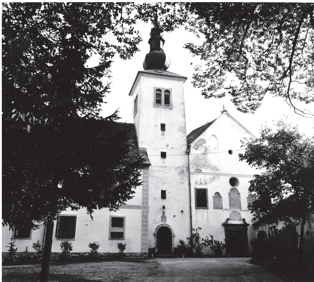
Kamensko, Pavlinski samostan i crkva Bl. Dj. Marije Snježne / Kamensko, Paulinian monastery and church of St. Mary of Snow

ma utisnutim na prijelazu u svetište i u pogledu na svetište, što ih u tlocrtu čini četverolisnim. Taj meki međuprostor svođeni je slavoluk koji pojačava domet dominantnog središnjeg prostora lađe pod visokom pandativnom kupolom. U nekim varijantama je to kupola s lanternom. Razlika je između Branjugovih baroknih crkava i dotadašnjih isusovačkih crkava golema. Taj tip crkve u Štajerskoj gradili su štajerski arhitekti i graditelji među kojima se ističe Johann Fuchs iz Maribora, podrijetlom Šlezanin. Zacijelo on potječe iz kruga graditelja bliskih češkoj graditeljskoj obitelji Dientzenhofen.