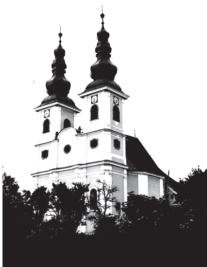
Sesvete, župna crkva / Sesvete, parish church

vatskih zemalja kroz kulturno-umjetnički program. Pavao Ritter Vitezović posredovao je u otkupu vrijedne biblioteke J. W. Valvazora, koju je biskup spojio sa starijim fondom skriptorija Zagrebačke biskupije i smjestio u novu zgradu, Biblioteku Metropolitanu. K tome, otkupio je grafičku zbirku koja broji oko 7000 grafika i crteža iz razdoblja od 15. do 17. stoljeća, među kojima su djela poznatih umjetnika Dürera, Cranacha, Schongauera i francuskih umjetnika.