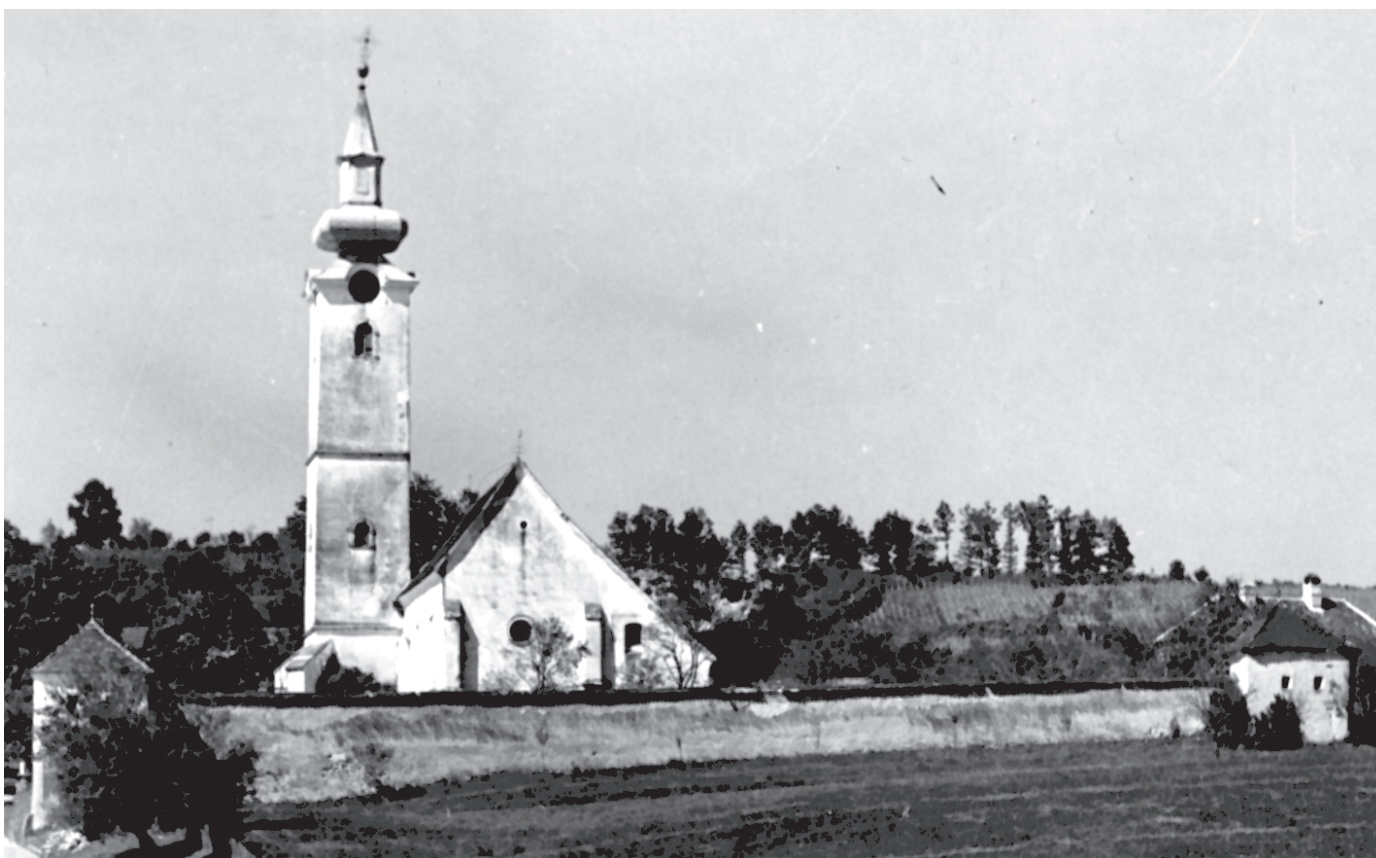
Gora, župna crkva Uznesenja Bl. Dj. Marije (snimljeno 1991.) / Gora, parish church of the Assumption of Our Lady (as in 1991).