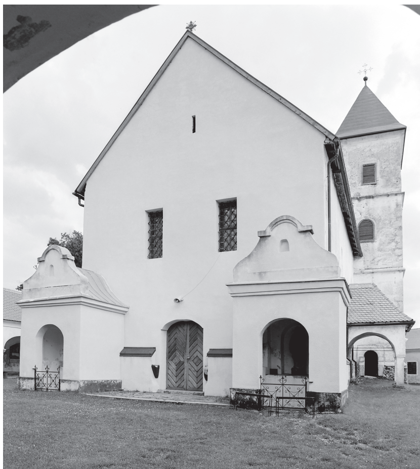
Lobar, proštenjarska crkva Marije Gorske / Lobar, pilgrimage church of Marija Gorska

nedugo potom gradili svoj sklop nisu mogli graditi ispod te visoke razine, pa povijesna jezgra Samobora ima prema tipu dvije crkve isusovačke provenijencije.