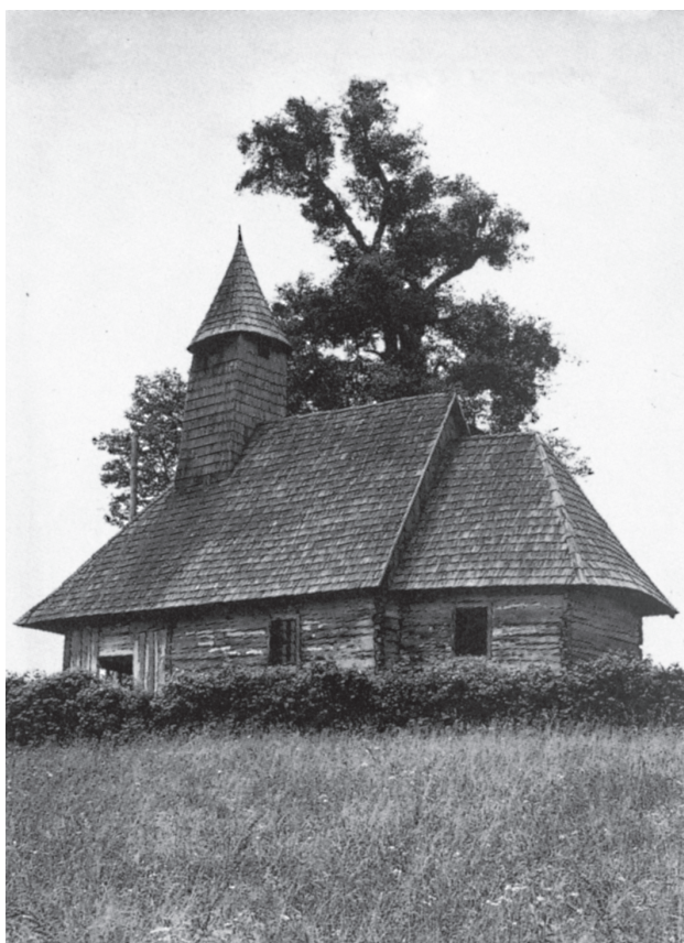
Poljana Lekenička, drvena kapela sv. Duha, pod krovom od šindre / Poljana Lekenička, wooden chapel of Holy Ghost, shingle roof

Do temelja je srušena župna crkva sv. Lovre u Petrinji, podignuta pod pokroviteljstvom carice Marije Terezije kao kumpanijska župna crkva vojnog središta. Od 1778. do 1781. g. opremili su je akademski bečki slikar Johann Meidinger, kipar Janez Jurij Potočnik iz Ptuja s pomoćnikom Marijom Galom, štukaterom i polikromatorom Josephom Gieglom, a graditelj monumentalnih orgulja bio je Ludwig Gess iz Graza.