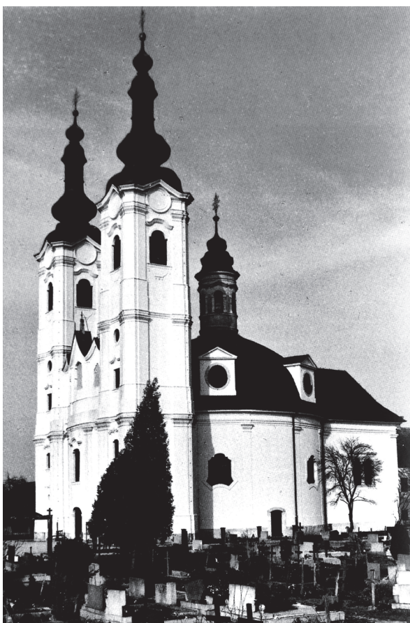
Sela kod Siska, župna crkva sv. Marije Magdalene / Sela near Sisak, parish church of St. Mary Magdalene