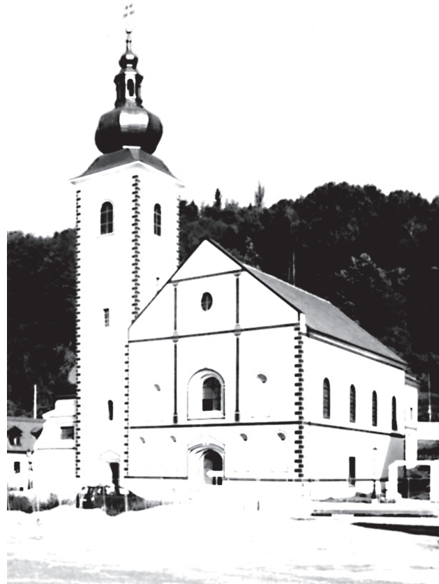
Hrvatska Kostajnica, obnovljeni Franjevački samostan i crkva sv. Antuna Padovanskog / Hrvatska Kostajnica, Franciscan Monastery and the church of St. Anthony of Padua (after renovation works)