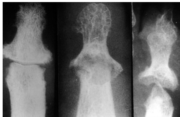
Sl. 3. Tipičan radiološki nalaz (tzv. "pencil and cup" promjene na distalnim falangama).

Nove metode slikovnog prikaza, uključujući tu ultrazvuk, MR (magnetsku rezonanciju) i MSCT (magnetsku kompjutorsku tomografiju) mogu pomoći u otkrivanju ranih promjena na perifernim zglobovima i mekim strukturama. Ultrazvuk je metoda izbora za proučavanje upalne aktivnosti koja zahvaća meke strukture. Primjenom ultrazvuka moguća je detekcija ranih promjena (edema, zadebljanja) kao i kasnih promjena (erozije i entenzofiti). Njegovom primjenom upotpunjuje se klinička dijagnostika, jer se radi o jednostavnoj, brznoj, neškodljivoj i jeftinoj metodi. Danas