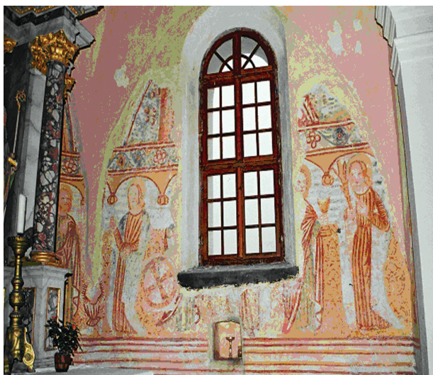
5. Kubed, crkva sv. Florijan / Kubed, church of St. Florian