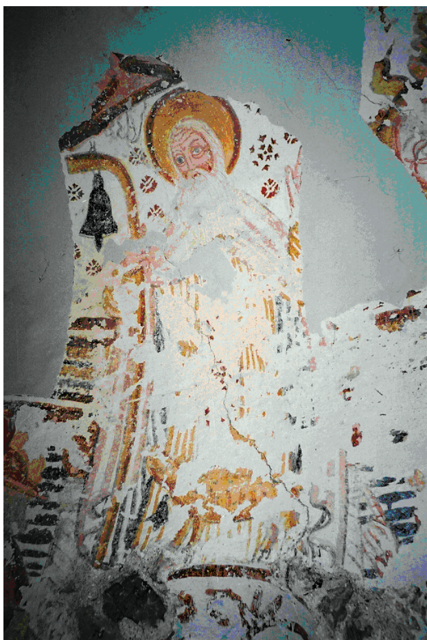
6. Zadobarje, kapela sv. Antuna Pustinjaka / Zadobarje, Chapel of St. Anthony the Abbot