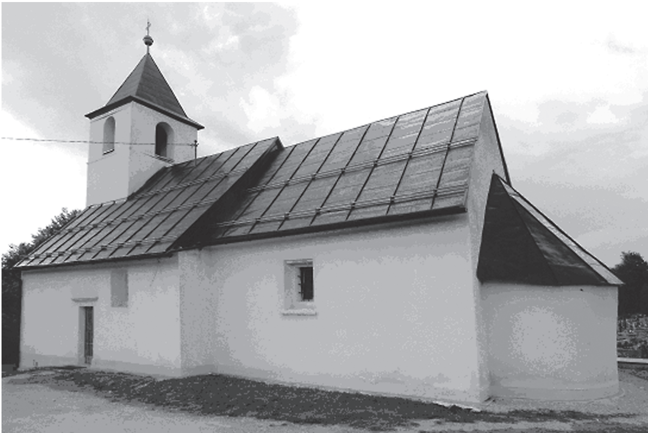
1. Zadobarje, kapela sv. Antuna Pustinjaka, južno pročelje (Zadobarje, Chapel of St. Anthony the Abbot, southern facade)