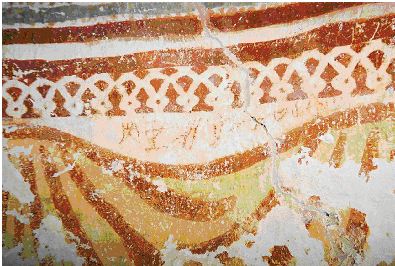
8. Zadobbarje, kapela sv. Antuna Pustinjaka, grafit u apsidi / Zadobbarje, Chapel of St. Anthony the Abbot, graffiti in the apse

le u Taboru pri Grosuplju 19 (sl. 9, 10). France Stele ih je u svojoj raspravi pripisao hrvatskoj skupini, a Höfler, opisujući scenu, tehniku slikanja i detalje oblikovanja, smatra da su slike u Grosuplju nastale kasnih četrdesetih godina 16. stoljeća. 20 Kako je prikaz golog Isusa s križem zabranjen poslije Tridentskog koncila, vjerojatno je i freska u crkvi sv. Antuna Pustinjaka nastala prije 1550. godine. 21 U donjim poljima istočnog zida trijumfalnog luka sv. Antuna Pustinjaka u Zadobbarju slikar je naslikao scenu Uskrsnuća smještajući lik ranjenog Krista u centar zadane plohe (obrubljene širokom trakom) kako izlazi iz sarkofaga prikazanog u obrnutoj perspektivi. S desne strane zida, u kazetnom polju prikazan je klečeći lik sv. Stjepana kojega kamenuju dva lika s karakterističnim kapama koje podsjećaju na sjevernjačko renesansno pokrivalo. Premda scena u cijelosti ne odgovara ikonološkim postavkama, možemo pretpostaviti da je ipak riječ o kamenovanju sv. Stjepana. Međutim, kompozicijske, oblikovne i likovne elemente zidnog oslika