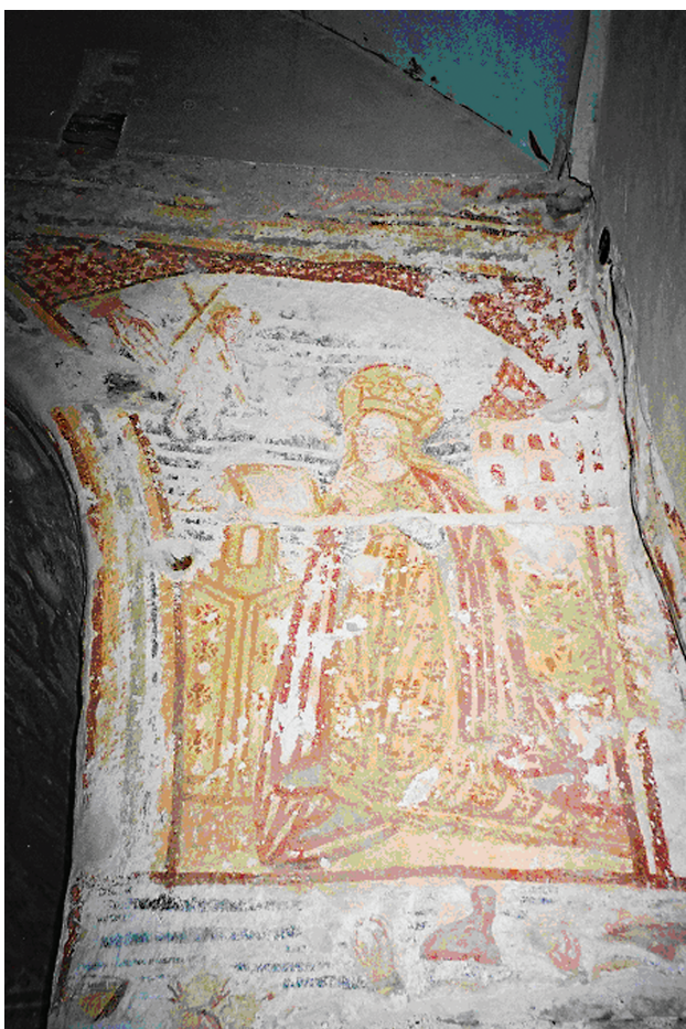
9. Zadoborje, kapela sv. Antuna Pustinjaka, Navještenje / Zadoborje, Chapel of St. Anthony the Abbot, Annunciation