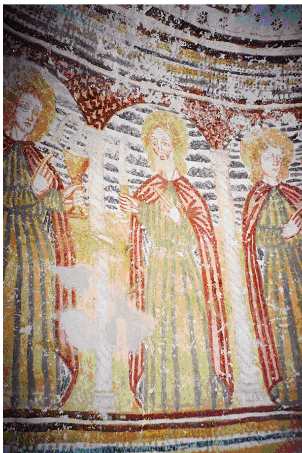
12. Zadobarje, kapela sv. Antuna Pustinjaka, apostoli (foto: Marinka Mužar) / Zadobarje, Chapel of St. Anthony the Abbot, Apostles (photo: Marinka Mužar)

ku i da prodiru prema Metliki. Iz Metlike stigli su u Ozalj, a ljudi su se sklanjali u špilju Brlog (današnja Vrlovka) te se spuštali do Dubovca zahvaljujući staroj komunikaciji Ozalj – Grdun – Zadobarje – Dubovac. Putom su »sve porobili, poginulo je 80–100 ljudi, porobljena je i sva stoka, porušene su crkve i žito spaljeno...«. 26 Pišući o migracijama stanovništva, Kruhek navodi podatak da je 1522. godine 5000 Turaka krenulo iz Kostela u Kočevje te preko Ribnika na Bosiljevo i Slunj. Godine 1524. turske pljačkaške čete preko Dubovca i Zadobarja stigle su do Metlike, a preko ozaljskog posjeda do Jasterbarskog. Iste godine Krsto Frankopan pisao je Ivanu Dandolu u Veneciju »...kako car Sulejman priprema goleme vojske protiv kršćana... kao što je eto prije malo dana poharao zemlje mojega oca oko Skrada i Dubovca«. 27 Tražeći pomoć od pape Hadrijana VI. za obranu od Turaka, Krsto I Frankopan, kao pobožni muž ispunio je zavjet prije puta u Rim, te između 1520. i 1523. godine izgradio zavjetnu kapelu Bl. Dj. Marije u Sveticama. 28,29 Budući da je Krsto I Frankopan u vrijeme turskih prodora na šire po-