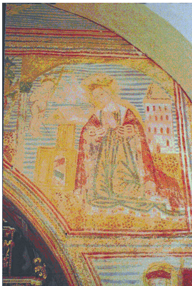
10. Tabor pri Grosuplju, crkva sv. Nikole, Navještenje / Tabor pri Grosuplju, church of St. Nicholas, Annunciation

Građevinski i konzervacijsko-restauratorski radovi u 2007. godini uvjetovani su otvaranjem zidne plohe sjevernog i južnog zida u lađi restauracijskom trakom širine šezdesetak centimetara radi konsolidacije zida. Na sjevernom zidu, osim arhitektonske naznake Betlehemske štalice otkriveni su likovi kralja i kraljice (između njih je zastava), a na južnom zidu naziru se prikazi otvora neke građevine i bljedolika ženska lica, pa možemo očekivati scene Rođenja , Poklonstva kraljeva i Pasije . Pažnju privlači lik kraljice, u renesansnoj odjeći s naznakom utegnutih rukava, čije lice obrubljuje tanka crna obrisna linija, unutar kojih se pojavljuju meki tonovi inkarnata. Likovnu obradu dosada otkrivenih oslika u lađi možemo usporediti s prikazom likova evanđelista u bočnim zidovima kasnogotičkog prozorskog otvora u svetištu u crkvi Bl. Dj. Marije u Sveticama, a daljnja istraživanja odgovorit će na pitanja kontinuiteta ili diskontinuiteta u vremenskoj i stilskoj odrednici.