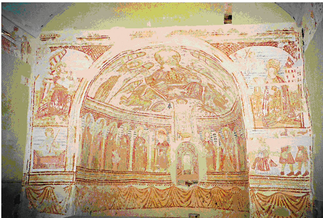
3. Zadobarje, kapela sv. Antuna Pustinjaka, pogled na unutrašnjost svetišta / Zadobarje, Chapel of St. Anthony the Abbot, interior of the sanctuary