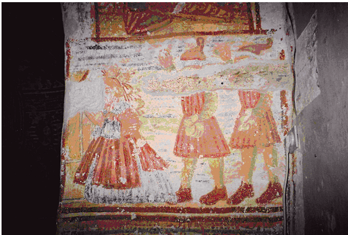
13. Zadobarje, crkva sv. Antuna Pustinjaka, klečeći lik sv. Stjepana Zadobarje, Chapel of St. Anthony the Abbot, St. Stephen kneeling