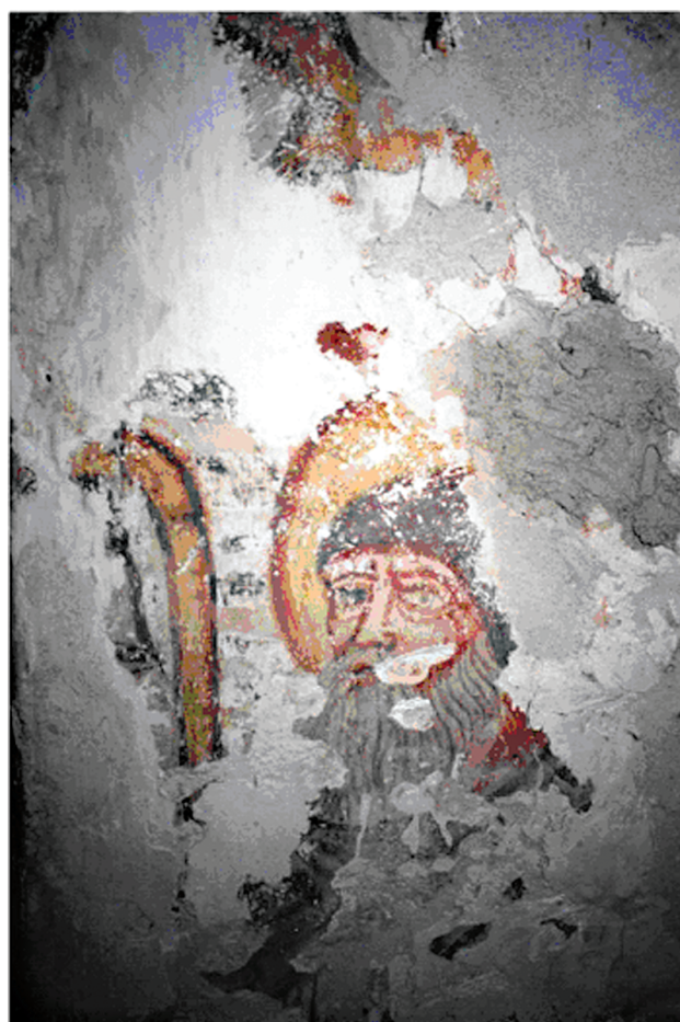
7. Svetice, župna crkva Bl. Dj. Marije, sv. Antun Opat / Svetice, parish church of St. Mary, St. Anthony the Abbot