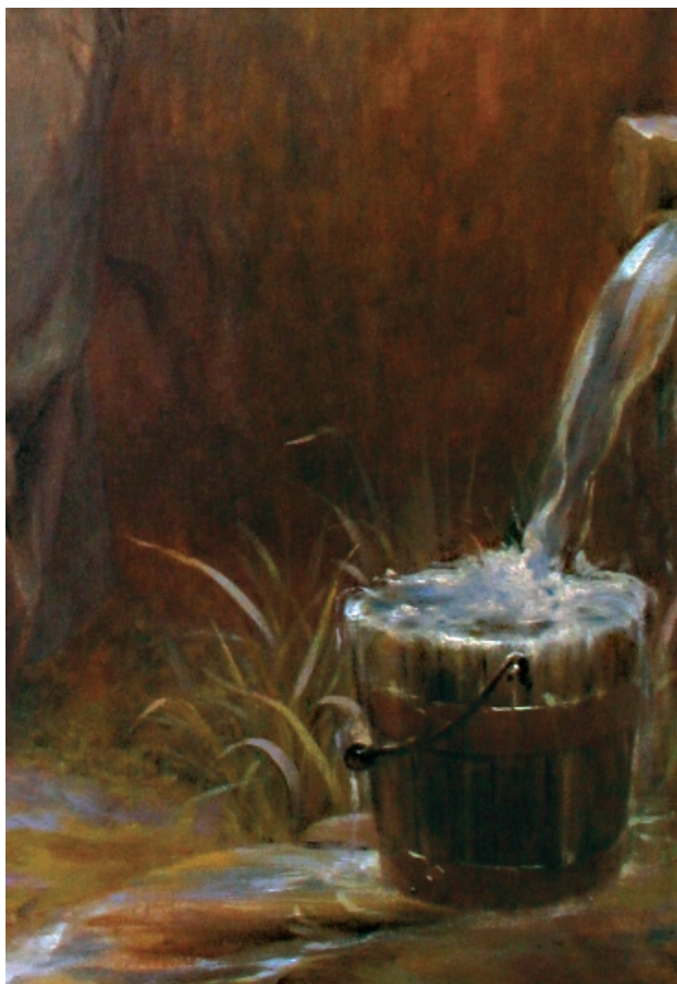
2. i 3. Vlaho Bukovac, Majka i dijete , detalji / Vlaho Bukovac, Mother and Child , details

Jedno od Bukovčevih najuspjelijih ostvarenja iz pariškog, tj. engleskog razdoblja, 4 slika je Majka i dijete , remek-djelo, koje je Bukovac u to vrijeme, već kao afirmirani slikar, naslikao u Parizu, ili Harrogateu, u nekoliko varijanti. 5 Danas su poznate samo dvije varijante spomenute slike. Osamdesetih i devedesetih godina 19. stoljeća Bukovac je stvorio djela koja su ga u najboljem svjetlu proslavila kao virtuozu kista. Slikao je iznimno lazurnim potezom i s velikom lakoćom, u pleneru, s nekim naznakama impresionističke poetike. U tom razdoblju, djela svojstvena Bukovčevu stilu i koloritu, s velikim brojem nijansi smeđe