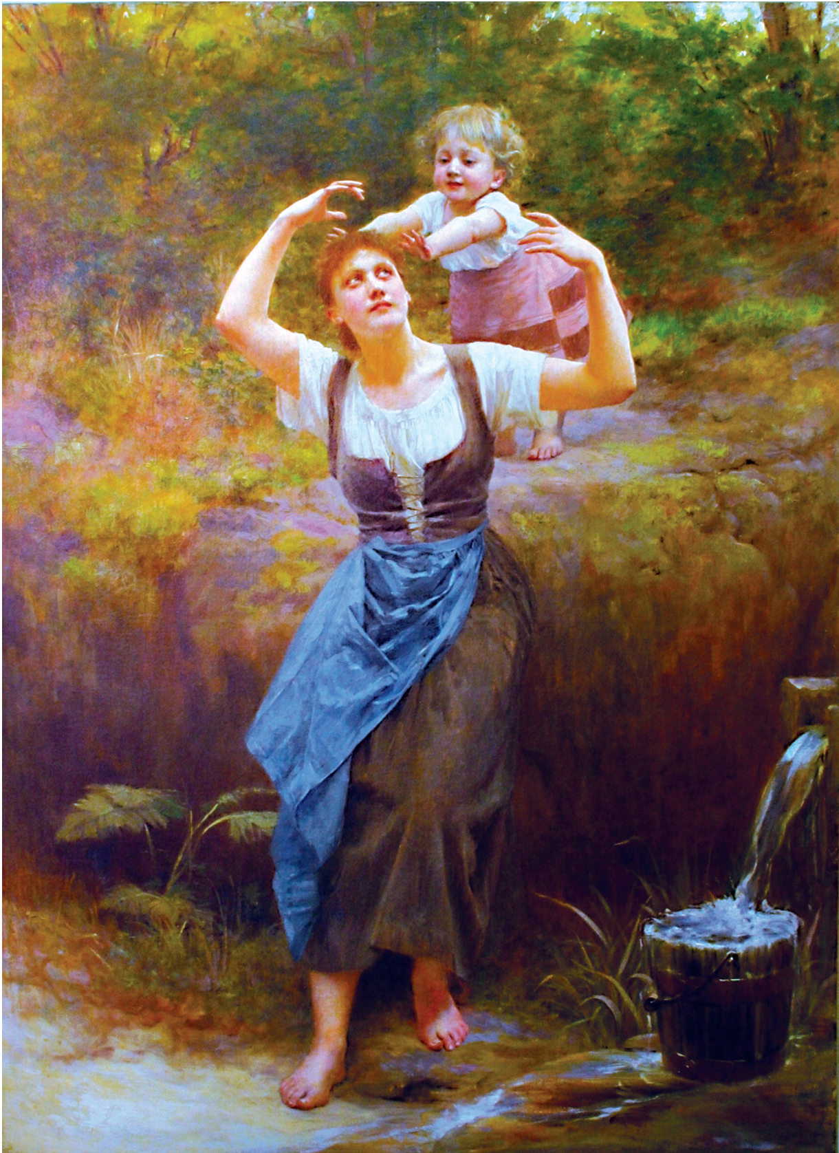
1. Vlaho Bukovac, Majka i dijete , 1890. / Vlaho Bukovac, Mother and Child , 1890.