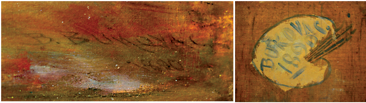
4. i 5. Potpis na prednjoj strani i poledini platna slike Majka i dijete / Signature at the front and back side of picture Mother and Child