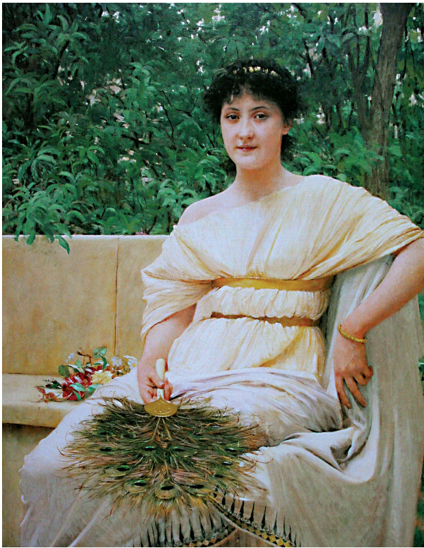
7. Vlaho Bukovac, Mlada patricijka (A), 1890. (V. Kružić Uchytíl, Vlaho Bukovac – život i djelo , 1855–1922, Zagreb, 2005, 68) / Vlaho Bukovac, Young woman (A), 1890. (V. Kružić Uchytíl, Vlaho Bukovac – život i djelo , 1855–1922, Zagreb, 2005, 68)

zu, najvjerojatnije iste godine. No, ako pažljivije proučimo spomenutu fotografiju, zatim sliku, može se zaključiti da je Bukovčeva nećakinja na fotografiji malo starija, negoli ju je on naslikao na spomenutoj slici. To možemo pripisati slikarskoj slobodi i Bukovčevu nastojanju da idealizira model te da ga približi ikonografskom motivu putta i tako naglasi bukolički sadržaj cijelog prizora. Tvrdnja gospođe Vere Kružić Uchytíl da je jedna od verzija ove iznimno uspjele slike nastala najvjerojatnije 1888. godine (manji format) 11 te kako je lako moguće da ju je Bukovac između 1888. i 1890. godine naslikao u nekoliko varijanti, bez izravnog sudjelovanja živih modela, samo je djelomice točna. Sliku Majka i dijete zasigurno je naslikao barem u dvije, danas poznate verzije, no veoma je upitno datiranje djela manjega formata u 1888. godinu. Smatramo da je prva slika s ovim motivom nastala tek 1890. godine (veći format). Po slici Majka i dijete većega formata Bukovac je najvjerojatnije načinio nekoliko varijanti slika manjih formata, što pouzdano objašnjava činjenica da su se najčešće (u pravilu) varijante slika manjega formata slikale prema predlošku, tj. originalu, većega, najčešće likovno uspjelijega, a nipošto obratno.