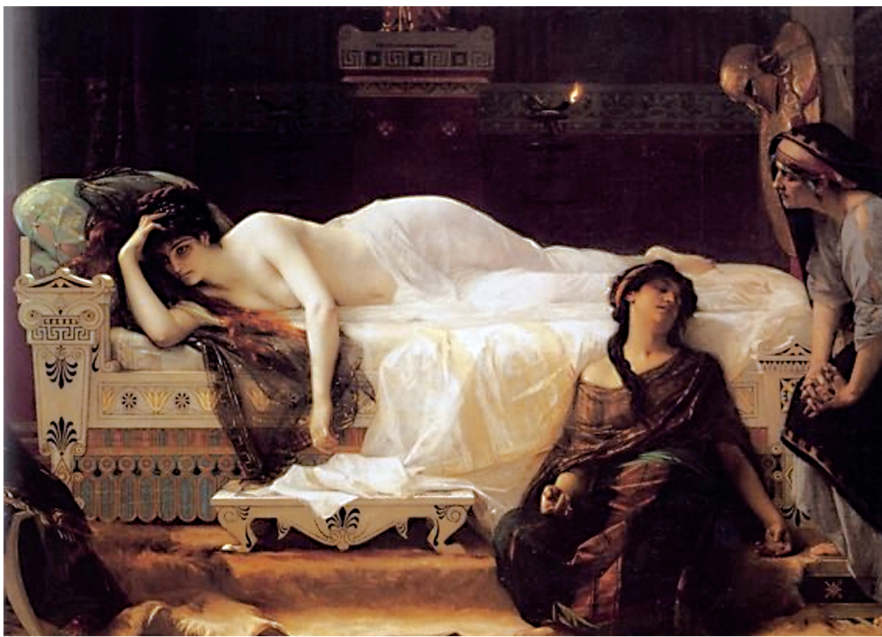
6. Alexandre Cabanel, Phèdre , 1880.

naslikanih majstorski, znalački i virtuosnim potezima kista, ali bez istinske umjetničke i stvaralačke snage te bez slikarske iskrenosti. Publika Bukovčeva vremena, a jednako s njom i kritika (ni danas stanje nije gotovo ništa bolje), zbog nerazumijevanja istinskih vrijednosti u umjetnosti, spomenute je slike glorificirala i slavila te ga upravo poradi tih djela smatrala, te ga još i danas smatra, vodećim hrvatskim slikarem uopće, što Bukovac, nažalost, ipak nije, ali je lako mogao biti. S minhenskim krugom hrvatskih slikara ( Die Kroatische Schule ), posebice se tu misli na Miroslava Kraljevića i Josipa Račića, ali i s još gotovo desetak slikara hrvatske moderne, koji su se na hrvatskoj slikarskoj sceni pojavili u drugom i trećem desetljeću dvadesetog stoljeća, hrvatsko slikarstvo dobilo je umjetnike, koji su svojim talentom, ali prvenstveno svojim djelom, Bukovca zasluženo zasjenili te ga ponešto potisnuli u drugi plan, ali u drugi plan samoga vrha hrvatskog slikarstva, gdje će zahvaljujući svojoj pariškoj fazi ta remek-djela, npr. Mlada patricijka (A) (sl. 7), Majka i dijete , a posebice Žena koja sjedi u šumi (sl. 8), Bukovac najvjerojatnije zauvijek i ostati.