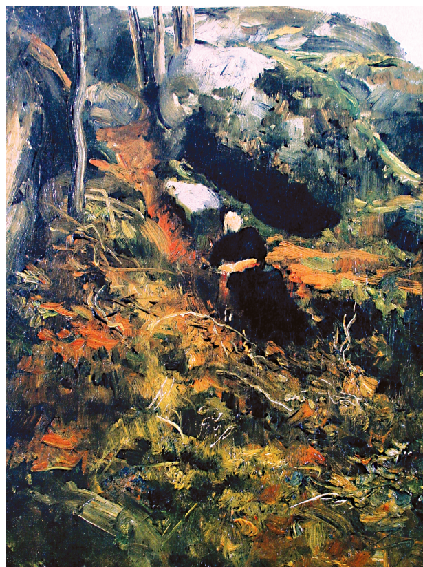
8. Vlaho Bukovac, Žena koja sjedi u šumi , oko 1886. (V. Kružić Uchytíl, Vlaho Bukovac – život i djelo , 1855–1922, Zagreb, 2005, 190) / Vlaho Bukovac, Woman who seath in the forest , around 1886. (V. Kružić Uchytíl, Vlaho Bukovac – život i djelo , 1855–1922, Zagreb, 2005, 190)

5 Nekoliko je činjenica u prilog pretpostavci da je slika Majka i dijete nastala za vrijeme slikareva boravka u Parizu, dok gotovo nijedna nije u prilog drugoj tezi, onoj koja tvrdi da je slika na-