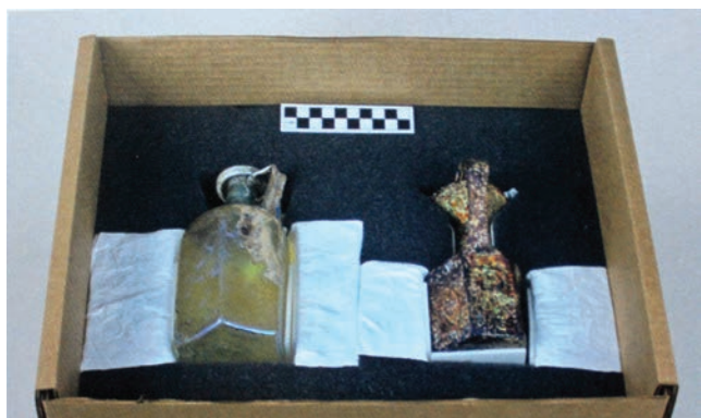
Sl. 10 Stakleni predmet pohranjen u odgovarajuću kutiju

težini staklenih nalaza. U takvim uvjetima od izrazite je važnosti redovita kontrola predmeta (sl. 10).