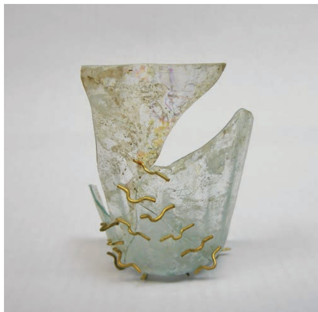
Sl. 7 Staklena čaša lijepljena je pomoću mesinganih klanfica Fig. 7 A drinking glass that has been glued together using brass clasps

After a preliminary cleansing, the glass fragments are then separated into wholes. The proper choice of adhesive before the recombination of the preserved fragments is of paramount importance because it is imperative to meet both the conditions imposed by the reversibility processes, and those associated with the materials used.