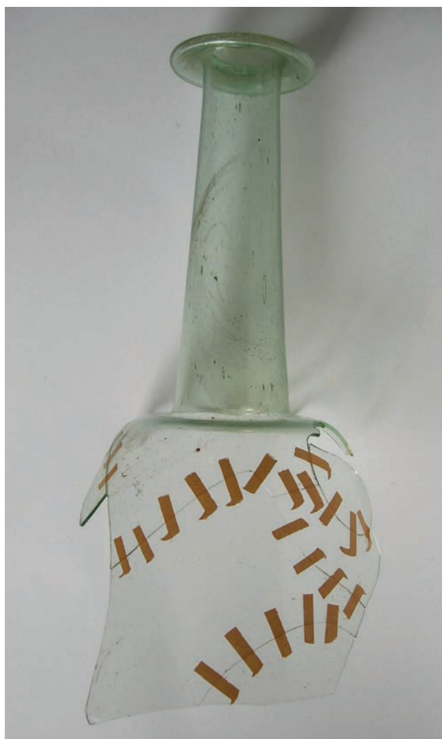
Sl. 6 Staklena boca integrirana je pomoću krep trake Fig. 6 A glass bottle integrated with the help of crepe adhesive tape

Nakon preliminarnog čišćenja stakleni se ulomci izdvajaju u cjeline. Prije rekonstrukcije sačuvanih ulomaka iznimno je bitan izbor vezivnog sredstva jer je potrebno zadovoljiti uvjete reverzibilnosti postupaka i upotrijebljenog materijala. Osim toga, treba voditi računa o neutralnosti u odnosu prema izvornoj površini, konstantnosti fizičkih i vizualnih karakteristika tijekom vremena i tijekom izlaganja različitim zračenjima te o niskoj viskoznosti ljepljiva potrebnoj za kapilarno prodiranje u spojeve (Perović 2008, 16).