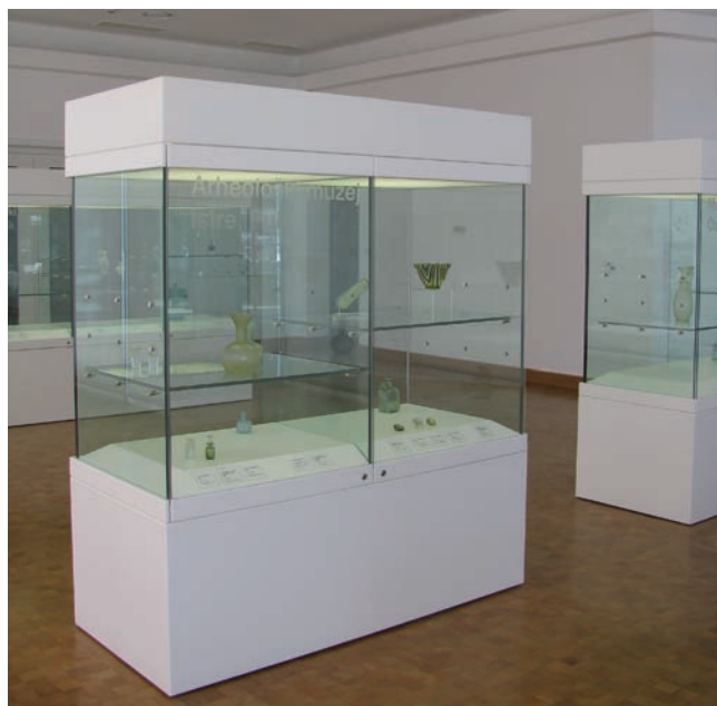
Sl. 12 Stakleni predmeti Arheološkog muzeja Istre na izložbi Antičko staklo Hrvatske - izbor u Muzeju antičkog stakla Zadar 2009.

velike vlažnosti zraka), koji se postavljaju prema potrebi. Također, prije izlaganja staklenih predmeta svi izvori topline (uključujući i svjetla) moraju biti pažljivo zaklonjeni ili regulirani, jer bi toplina mogla potaknuti propadanje. Svaka svjetlost, slaba ili jaka, uzrokuje oštećenja; razlika je samo u stupnju oštećenja. Jačina svjetlosti mjeri se svjetlomjerom, u luksima. Najveća osvjetljenost koja se preporuča za staklene predmete je između 50 i 70 luksa. Umjetno svjetlo (vitrijska svjetla ili reflektori usmjereni na predmete) treba filtrirati da bi se uklonile ultraljubičaste (UV) zrake koje uzrokuju fotodegradaciju. Oštećenje djelovanjem svjetlosti (fotodegradacija) nikada se ne može potpuno eliminirati, no može se smanjiti ograničenjem vremena osvjetljenja predmeta na minimum, osvjetljenošću na razinu potrebnu za ugodno promatranje te eliminacijom ultraljubičastog (UV) zračenja. Razina tog zračenja mjeri se UV monitorom koji mjeri postotak UV zračenja koje pada na određeni predmet. Filtri koji sadrže spoj što upija UV svjetlost postavljaju se između svjetlosnog izvora i predmeta koji treba zaštititi. Postoji više oblika takvih filtara: UV filtar, akrilni ili polikarbonatni listovi, UV premazi koji se nanese na površine te stvaraju nevidljiv film, polieterski filmovi koje proizvođači priljepljuju na staklo vitrina ili prozorsko staklo te filtarske navlake za neonske svjetiljke ("Osnove zaštite i izlaganja muzejskih zbirki", 1993.) (sl. 12).