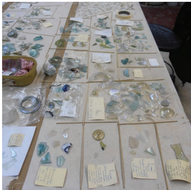
Sl. 5 Stakleni ulomci izdvojeni u cjeline

Fig. 4 Glass balsamaria before cleansing