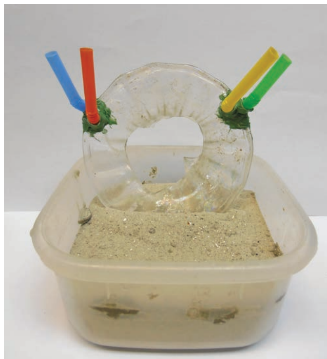
Sl. 9 Stakleni predmet pozicioniran u posudi s pijeskom

the original. When filling gaps, particular attention should be paid to the visual conspicuity of the differences between the original and reconstructed (filled-in) sections, which can be accomplished by using different nuances, or different grades of transparency (Fig. 9).