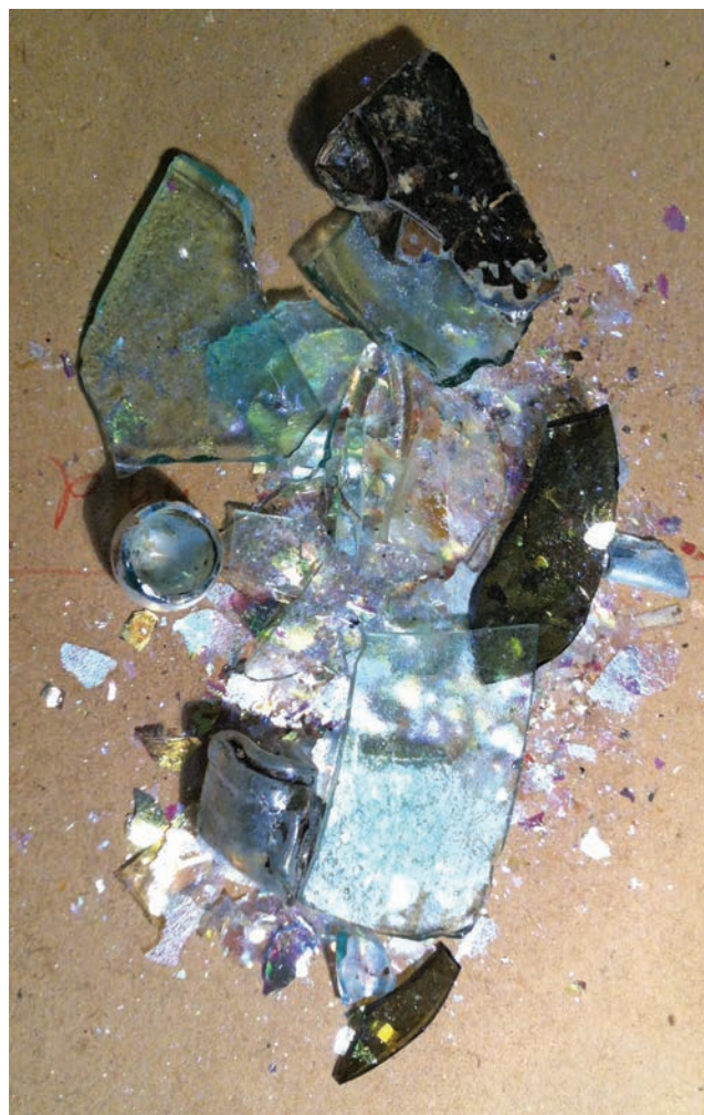
Sl. 3 Staklo u procesu irizacije

Irization is a process whereby alkalis are released. It is caused by changes in the values of air (humidity) present where the archaeological object is kept. Water absorption is the main factor that drives alkalis towards the surface of the glass, which subsequently create thin surface layers that are prone to laminating and peeling. We recognize them as forms that go into one another in the colors of the rainbow, i.e., a series of such layers, or else they constitute a thick, opaque crust, white in color. The crust may fall off in some places, exposing thus the hollowed surface of the glass underneath (Perović 2008, 15) (Fig. 3).