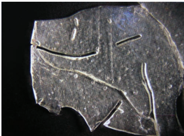
Sl. 2 Ulomak stakla u procesu devitrifikacije

Fig. 2 A glass fragment in the process of devitrification.