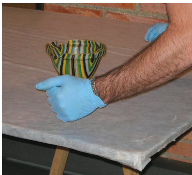
Sl. 11 Rukovanje staklenim predmetima oprezno u pvc ili pamučnim rukavicama

Glass objects are generally fragile, and as such they can be easily damaged or broken as a result of inappropriate handling. They are sensitive to sudden changes in temperature, even to the warmth of the palms. Glass objects are very lightweight and can be easily tipped over. The use of cotton gloves is recommended for handling; the object should be embraced with the entire palm of one hand, and supported at the base with the other hand in order to protect it during handling. We should never carry more than one glass item at a time, unless they are in a cardboard or plastic box or in a basket, with individual objects well lined with acid-free paper and protective sponge (Fig. 11).