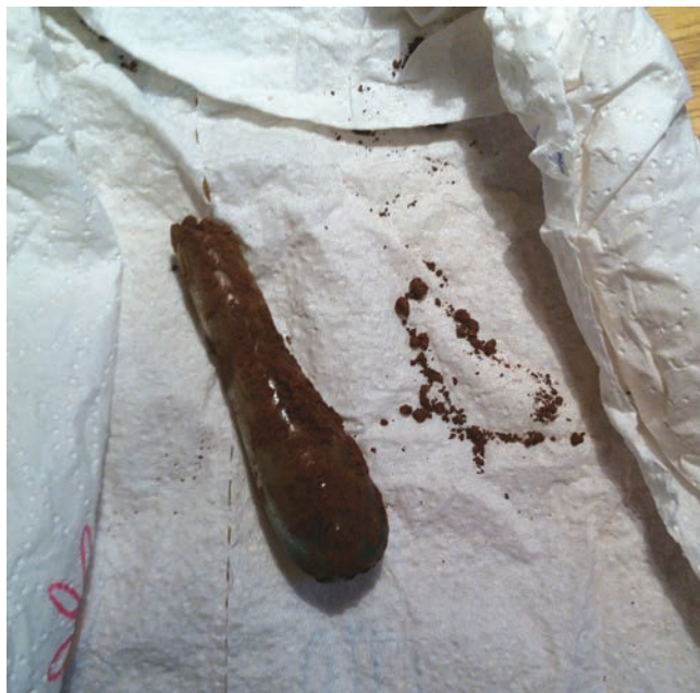
Sl. 4 Stakleni balsamariji prije čišćenja

Fig. 4 Glass balsamaria before cleansing