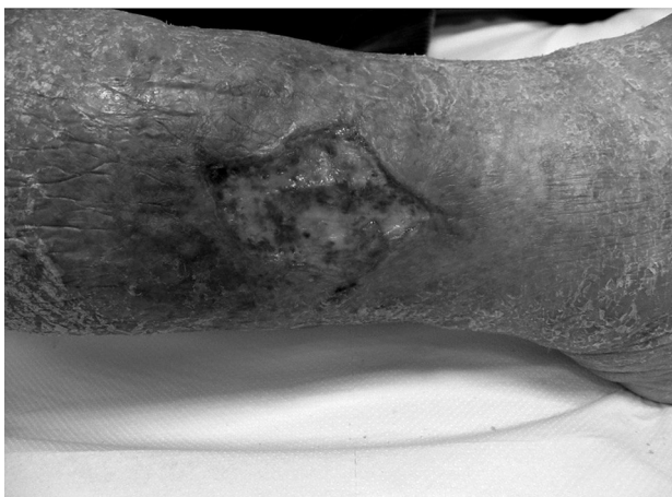
Sl. 1. Rana kod dolaska; započeta je primjena karboksiterapije