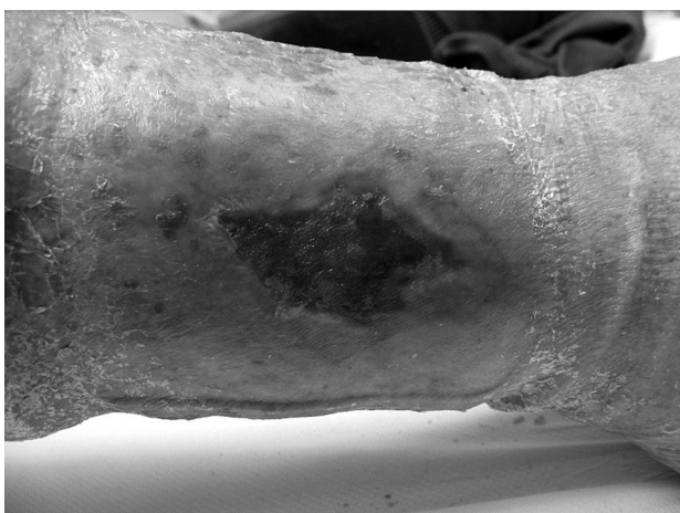
Sl. 3. Rana nakon 6 tjedana karboksiterapije