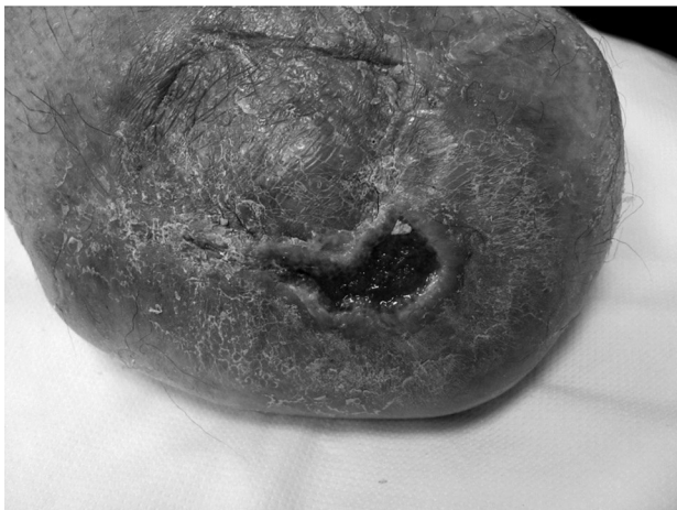
Sl. 8. Rana nakon 5 tjedana karboksiterapije