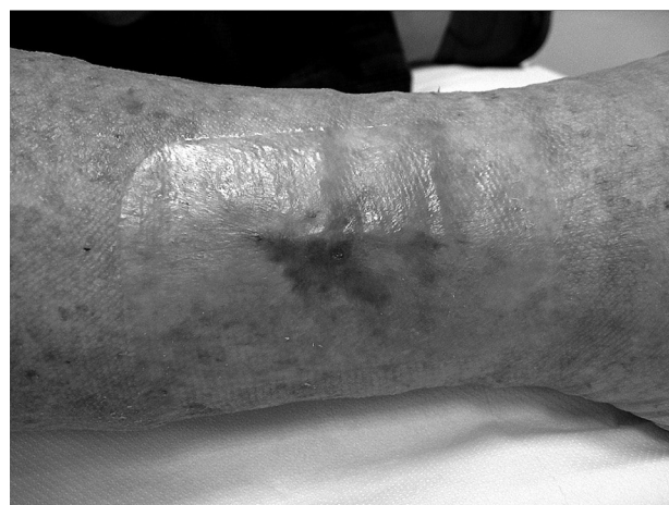
Sl. 4. Zacijeljenje rane nakon 9 tjedana karboksiterapije

obliku peckanja. Kako je cijeljenje napredovalo, bolnost se smanjivala pa su tretmani bili bezbolni.