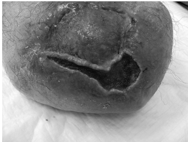
Sl. 7. Rana nakon 2 tjedna od početka terapije; uvođenje karboksiterapije