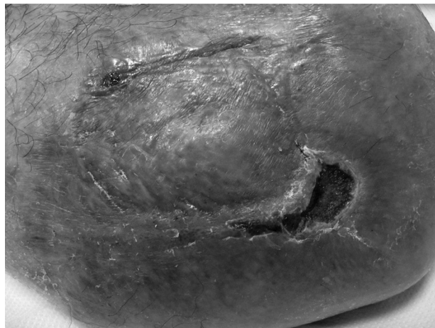
Sl. 9. Rana nakon 10 tjedana karboksiterapije

Terapija: provedena je lokalna terapija pokrivalima za rane te kompresivna terapija bataljka sistemom kratkoelastičnih zavoja do prepone. Nakon prva dva tjedna lokalnog liječenja i faze čišćenja rane u dnu rane vidi se crveno granulacijsko tkivo (sl. 7). U ovoj fazi kao potporno liječenje uvodimo primjenu karboksiterapije s uređajem i preporučenim protokolima dvaput tjedno (7). Tijekom postupaka karboksiterapije bolesnik nije imao nuspojava. Rana uredno cijeli (sl. 8.) te je njezina površina znatno manja nakon 6 tjedna primjene karboksiterapije (sl. 9). Očekujemo potpuno zacjeljivanje rane unutar predviđenih 12 tjedana.