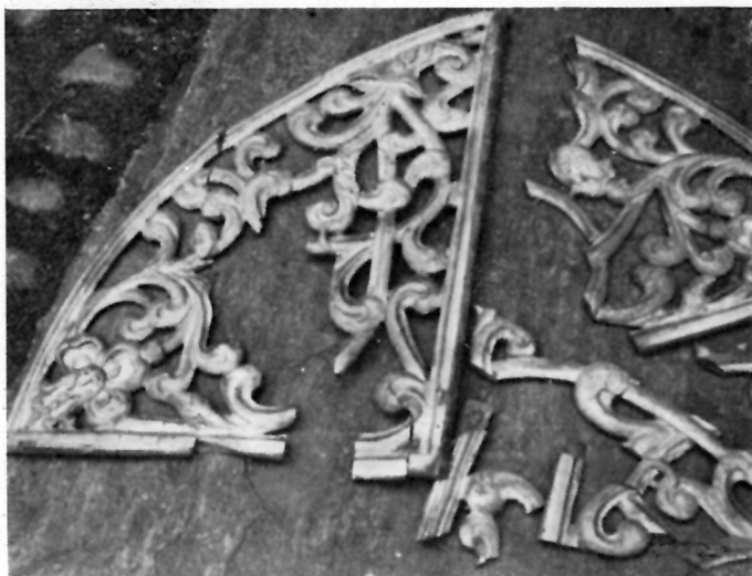
2 ORNAMENTALNI UKRAS ORGULJA U KAPELI SV. VUKA U VUKOVOJU