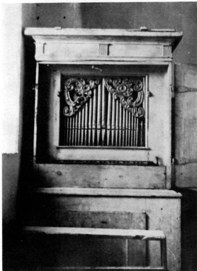
7 ORGULJE U KAPELI SV. FLORIJANA U ZLOGONJU (Višnjica)

đen s desne strane orgulja. Klavijatura se sastoji od jednog manuala, pedala i deset registara. Perše se u svom članku poziva na ljetopis i navodi da su orgulje izvrsno djelo ( eximae sonantiae ), a te riječi ljetopisca potvrđuju i to, što su se orgulje, iako popravljene, do danas sačuvale. Perše spominje da su svirale načinjene od prvorazrednog kositra. 13