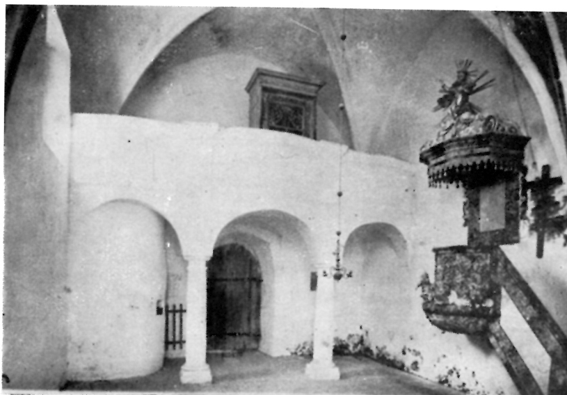
1 ORGULJE U KAPELI SV. VUKA U VUKOVJU