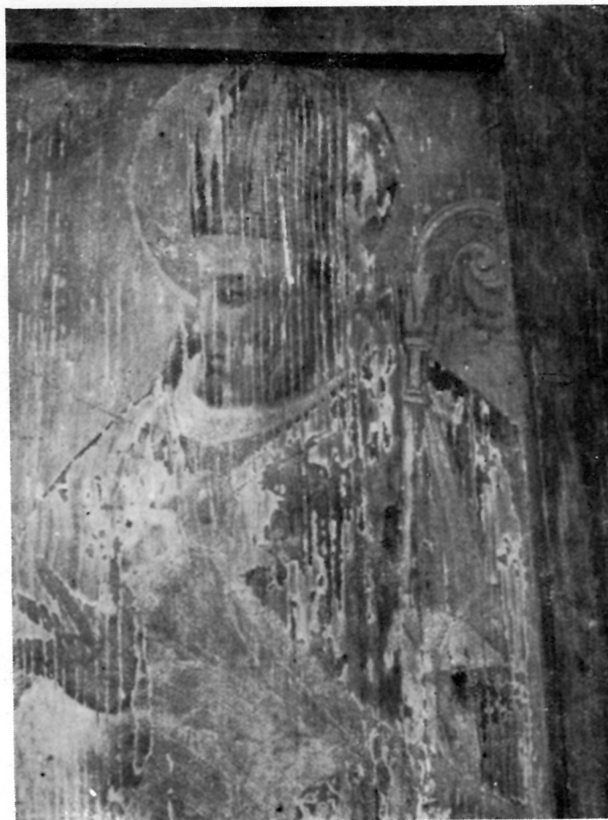
3 LIK SVECA NA VRATNICAMA ORGULJA U KAPELI SV. VUKA U VUKOVOJU