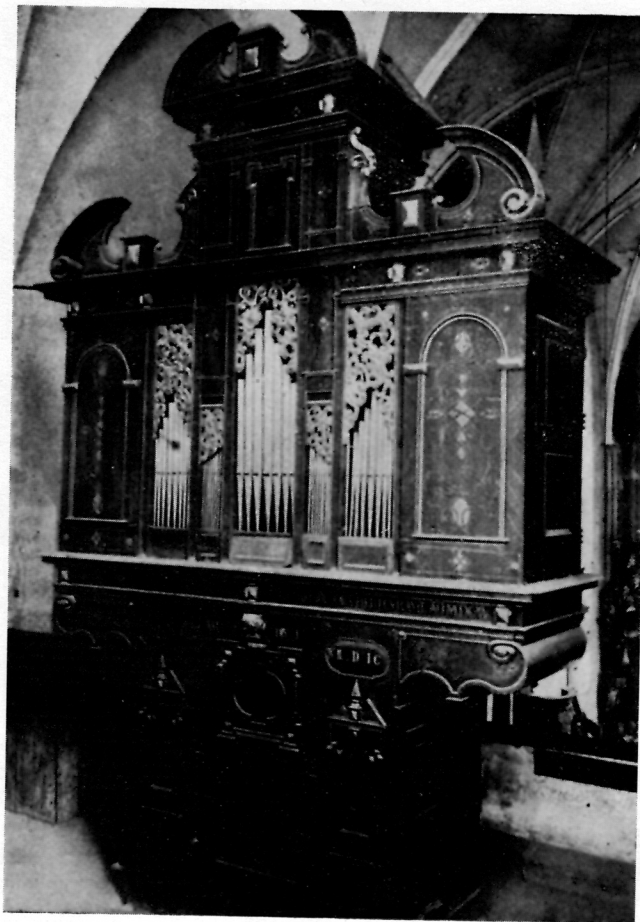
6 ORGULJE U CRKVI MAJKE BOŽJE IMMACULATAE U LEPOGLAVI

Lepoglava , ž. crkva B. M. V. Immaculatae gotička je barokizirana crkva. Orgulje su smještene nasred visoka zidana kora ispod mrežasta gotička svoda (sl. 6). Kućište leži na visokom postamentu i završava na bočnim stranama volutama i profiliranim vijencem. Prospekt kućišta je podijeljen u pet polja koja su ispunjena sviralama raznih dimenzija; najistaknutije su one u srednjem polju. Usne svirala leže u istoj ravnini. Srednji je toranj viši od bočnih i završava prelomljenim zabatom na isti način kao i bočni tornjevi. Iza svakog prelomljenog zabata proviruje šiljasti drveni tornjić. Između tornjeva umetnuta su mala polja s ravnom tra-beacijom.