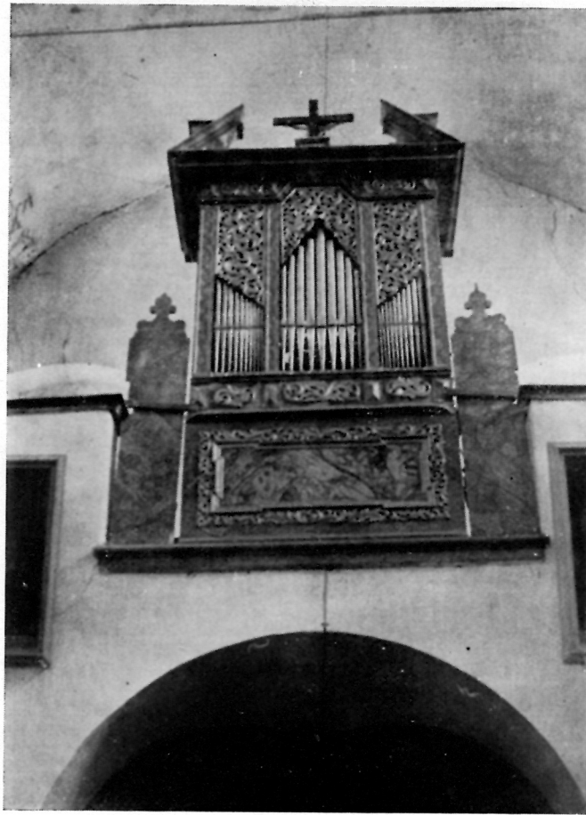
8 ORGULJE U CRKVI SV. LEONARNA U KOTARIMA (župa Okić)

ran dodatkom motiva rokaja i akantusova listića. Prospekt završava frizom triglifa i slabo profiliranim vijencem. Sviraonik je ugrađen s prednje strane prospekta. Klavijatura se sastoji od jednog manuala i 27 punih tonova.