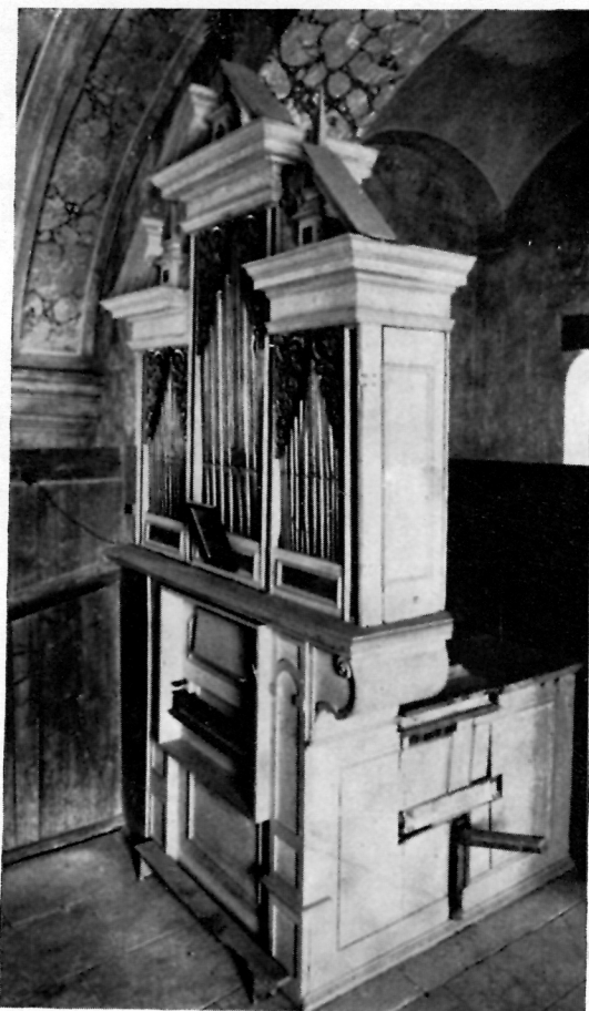
9 ORGULJE U KAPELI SV. FLORIJANA U VARAŽDINU

je izvjesnu dinamiku, koja ne odgovara tipu ovih orgulja ranije građenih. Za drugu polovinu XVII st. govore prelomljeni zabat, ornamentalna draperija gustog akanta, koja se na bočnim stranama koso spušta prema sredini, zatim puna draperija sa trokutastim završetkom, uklada sa karakteričnim okvirom kao i mehanika orgulja. Sviraonik je otraga ugrađen u kućište. Cetverouglasta, perforirana, velika uklada prekriva stražnji dio pozitiva nad manualnom klavijaturom. Izrezbarena je u motivu hrskavice. Kroz nju se gleda na žrtvenik. Uz nju je pričvršćen stalak za note. Oblikom odgovara vremenu gradnje pozitiva. Manual ima dvadeset sedam punih tonova. Puni tonovi su obloženi slonovačom. Polutonovi su crni. Uz manual nalaze se desno tri, a lijevo četiri drvena registra. Registri su po obliku elipsoidne