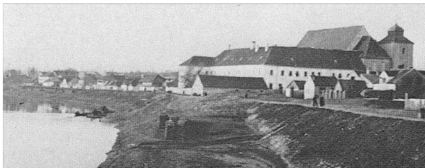
Crkva i franjevački samostan u Slavonskom brodu početkom 20. stoljeća.