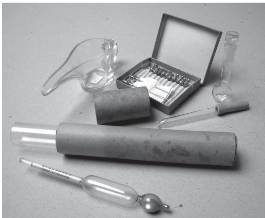
Slika 8. Medicinski pribor iz Ederove ostavštine