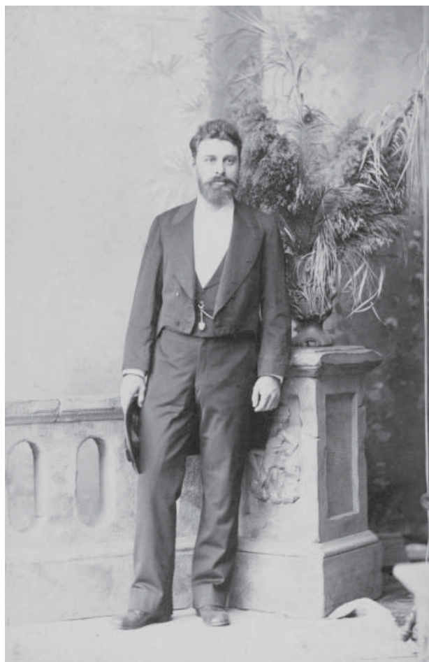
Slika 1. A. Eder, 1895.

uređenja i organizacije tamošnjih bolnica, kako bi nova saznanja primijenio u organizaciji i opremanju novog očeva sanatorija u Beču.