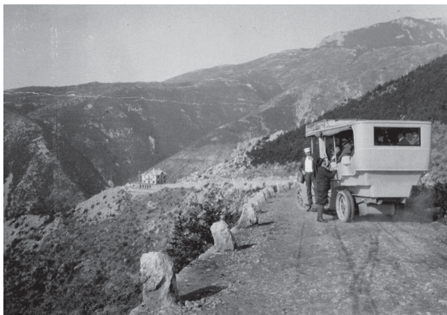
Slika 7. Komisija na Učki, 1912.