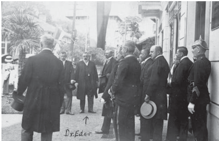
Slika 4. Svečanost otvorenja zgrade Lječilišnog povjerenstva, Lovran 1909.

srednjoeuropskih centara 13 bili su više nego povoljni uvjeti za razvoj turizma ovoga kraja. Tako je isprva izletničko mjesto Riječana i opatijskih gostiju počelo sve više dobivati karakteristike turističkog odredišta. Na pojasu od gradske lučice do Ike uređuje se obalni put te se grade vile i ljetnikovci, a odlukom Istarskog pokrajinskog sabora u Puli, na sjednici održanoj 16. veljače 1898., definirani su temeljni propisi i površina lječilišta Lovran. Ono je uključivalo područje od potoka u Iki do potoka u Cezari, te od mora kilometar daleko u brdo 14 . Godine 1909. osnovano je Lječilišno povjerenstvo za Iku i Lovran, a njegovim upraviteljem postaje dr. Albin Eder. Doktorovim nastojanjem Općina je provela mnoge radove na revitalizaciji mjesta, poput uvođenja kanalizacije, vodovoda i električne rasvjete te premještanja starog groblja iz samog središta u predio Skaje iznad Lovrana 15 . Fundus Hrvatskog muzeja turizma čuva malen fotoalbum 16 sa šest fotografija kojima su uvijekovječeni upravo trenuci otvorenja zgrade Lječilišnog povjerenstva u Lovranu.