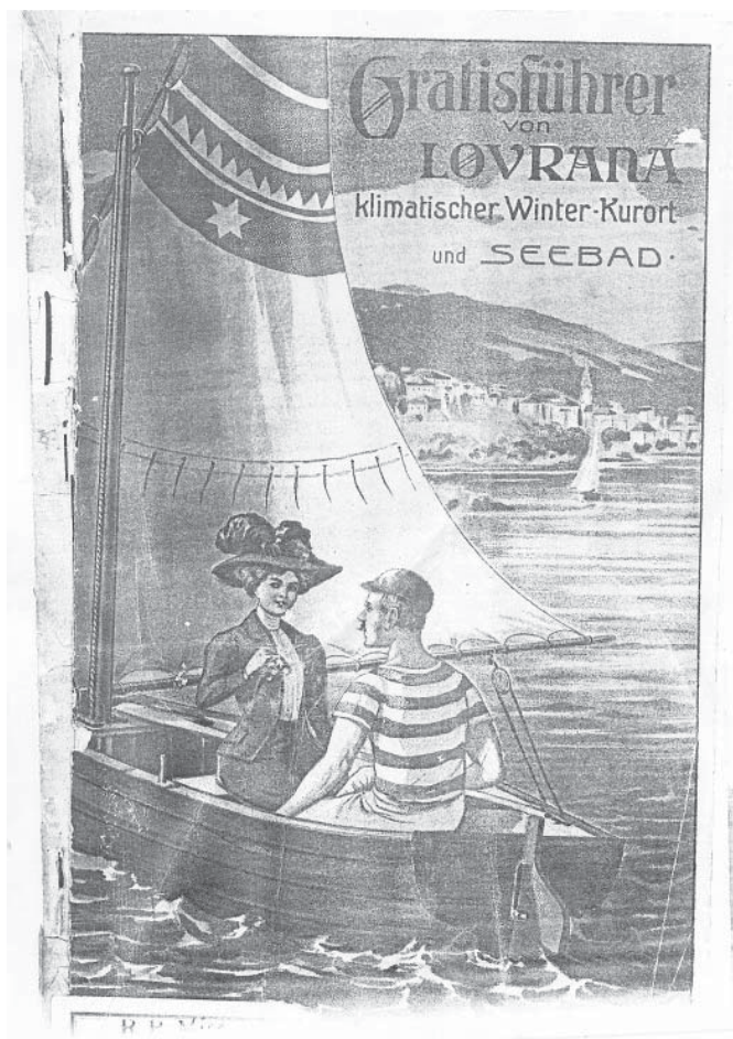
Slika 2. Naslovnica Vodiča 1911.

posljednjem izdanju te je istaknuto da je riječ o trećemu izdanju. Zamjetna je novina nastup Lječilišnog povjerenstva Lovran kao izdavača, a treba spomenuti i da je ovaj vodič jedini kojemu je tekst položen horizontalno, odnosno čiji je hrbat na užoj strani vodiča. Datiran je također prema popisu gostiju iz prethodne godine. 24 Ni u ovome vodiču nije navedeno mjesto izdanja, ali je zato zamjetna promjena tiskare, koja više nije u Rijeci nego u Innsbrucku 25 .