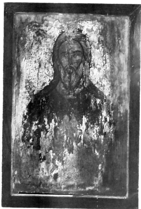
1 Иконата пророк Илија, пред конзервација