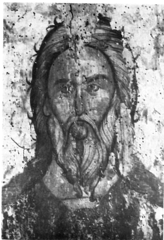
3 Иконата пророк Илија — детал