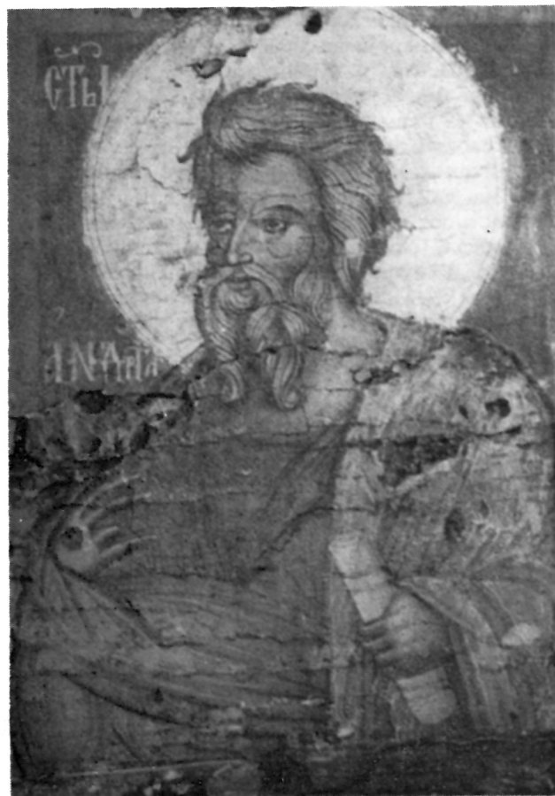
5 Деизисната плоча од манастирот Зрзе, св. Андреја

на светителот, со право овој лик е идентификуван од страна на С. Радојчиќ како пророк Илија. 2