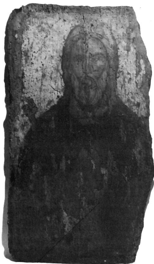
2 Иконата пророк Илија, по конзервацији