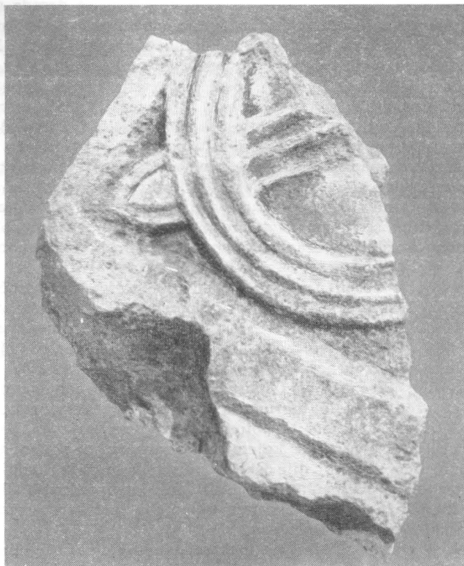
Pleterni ulomak nađen u ruševinama crkve u Sudanijelu kod Segeta

krovu antičkog hrama Dioklecijanove palače 8) ili vrh crkvice sv. Mikule na Stagnji sred Velog Varoša podignutim u XI—XII stoljeću. 9)